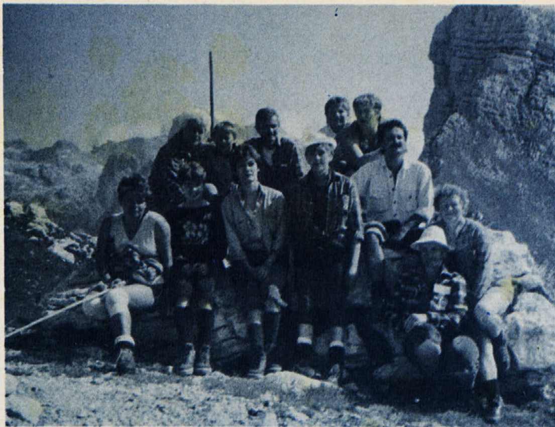
Spomin na tri čudovite dni v naših planinah.

Marsikomu se zdi, da je bilo prenaporno, ko mu povem, da smo prvi dan hodili 6—7 ur. Toda ne morem opisati navdušenja, ki nas je prevzelo, ko smo prišli na cilj. Pozabila sem na težke noge, na prepoteno čelo in na težak nahrbtnik. Med potjo srečujem neznance, ki pa v trenutku postanejo prijatelji, saj te vsak prijazno pozdravi in ogovori. Na vsej poti smo občudovali gorsko cvetje bogatih in raznovrstnih barv. Pogledov kar nismo mogli ločiti od murk, modrih encijanov, planik, kar vse ponuja dolina Sedmerih triglavskih jezer. Najlepši je bil razgled v kristalno čistem jutru, ki se je rodilo po nočni nevihti. Nepo-