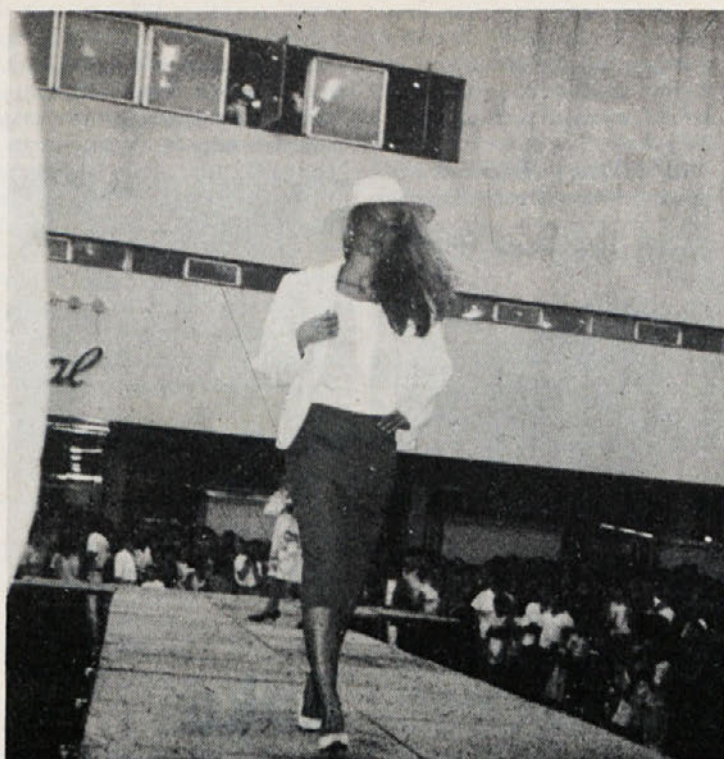
Z modne revije v Splitu, ki jo je Labod organiziral v svojem akcijskem tednu pri trgovskem podjetju Jadran tekstil. Revija je bila zelo odmevna.

Oznaka »palast« se nanaša na barve za moška oblačila. Pri tem je mišljena notranost gradov (palac).