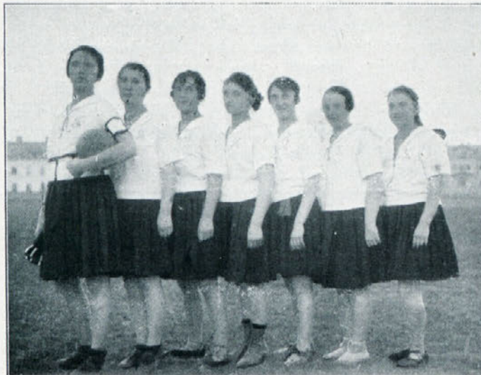
Sportni teden 1921: Rokornetna skupina S. K. Ilirija, Slovenija, prvak v rokometu.

Damske konkurence so prinesle lepe, z ozirom na kratek trening nepričakovane uspehe. Pri teku