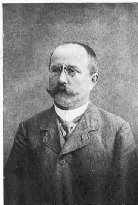
MINISTER JOŽ. GOSTINČAR

IZDALA JUGOSLOVANSKA STROKOVNA ZVEZA V LJUBLJANI