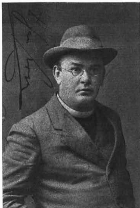
† Dr. J. Ev. KREK