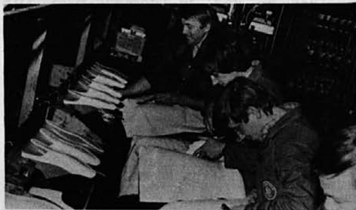
Iz naše montaže