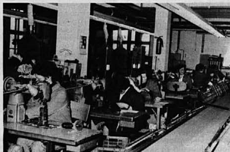
Čimbolj urejene razmere želimo našim sodelavkam ob njihovem prazniku!