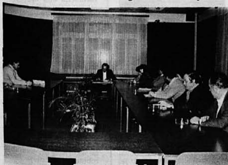
Na zasedanju konference osnovnih organizacij zveze sindikatov Alpine so ocenili preteklo delo in načrtali prihodnje usmeritve, ki predvsem težijo k izboljšanju delovnih in življenjskih razmer delavcev