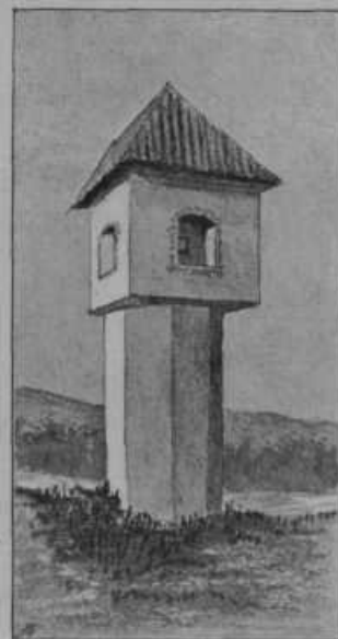
Staro zanimivo znamenje v Lokah pri Mozirju iz časov, ko je vladala kuža po Sloveniji.