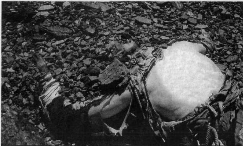
Malloryjevo truplo, kot ga je našla iskalna odprava

Osupljivo odkritje Malloryjevega trupla znova odpira vprašanje, kaj se je zgodilo potem, ko je skupaj z Andrewom Irvinom izginil v megli tistega usodnega junija leta 1924. Če je bil že mrak, je skoraj gotovo padel med vračanjem v dolino. Toda že se postavi drugo vprašanje, ki je še vedno brez odgovora: je Mallory dosegel vrh, preden se je obrnil? Gorniki pravijo, da je