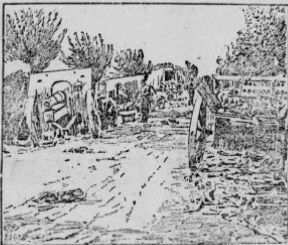
Upljenjena italijanska artiljerija ob Tilmentu.

Nemški uspeh pri Cambrai. Angležem pri Cambrai bolj slaba prede. Na južnem in na severnem delu njih izbočene bojne črte pritiskajo Nemci z vedno večjo silo. Pod tem pritiskom je moral Anglež izprazniti najsrednejše postojanke. Na 10 km