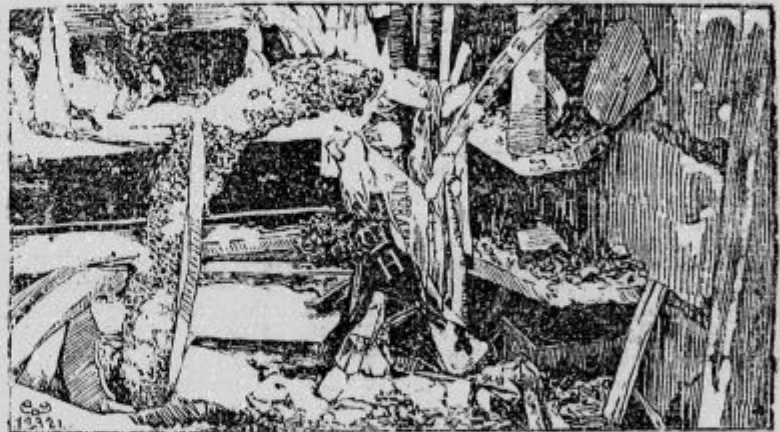
Razdejano rodbinsko grobišče kneza Turn-Taksis-a v devinskem gradu.

Zdaj bo treba iti skozi fronto, si mislim, ako bo mogoče. Pripravim se z vsem: dobim lopato in kramp, ako bo treba koptati skrivališče. Blizu pozicije je imela omenjena žena gozd in travnik. Tja skrrije svojo živino pred Rusi. Tudi jaz sem šel tja in poizvedoval, kaj je z ofenzivo. Neko popoldne pa prideta dva Rusi. Jaz sem se jima skrnil. Odženeta nam dve najlepši kravi in eno svinjo; ženo in njeno sestro pa so do skrajnosti natepli. Potem pa sta ti ubogi ženi odgnali ubogo živino v drugi kraj skrit, jaz sem si pa skopal skrivalno jamo med gostimi smrekami. Topovi so grmeli, da se je vse treslo. Že tretji dan popoldne se začuje blizu mene strašno zmešnjava. Rusi so namreč par korakov pred