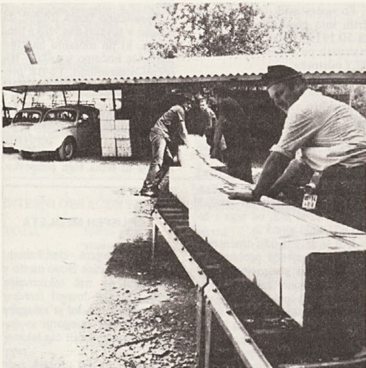
V TPP smo bili lansko leto precej časa na tesnem s skladišči.