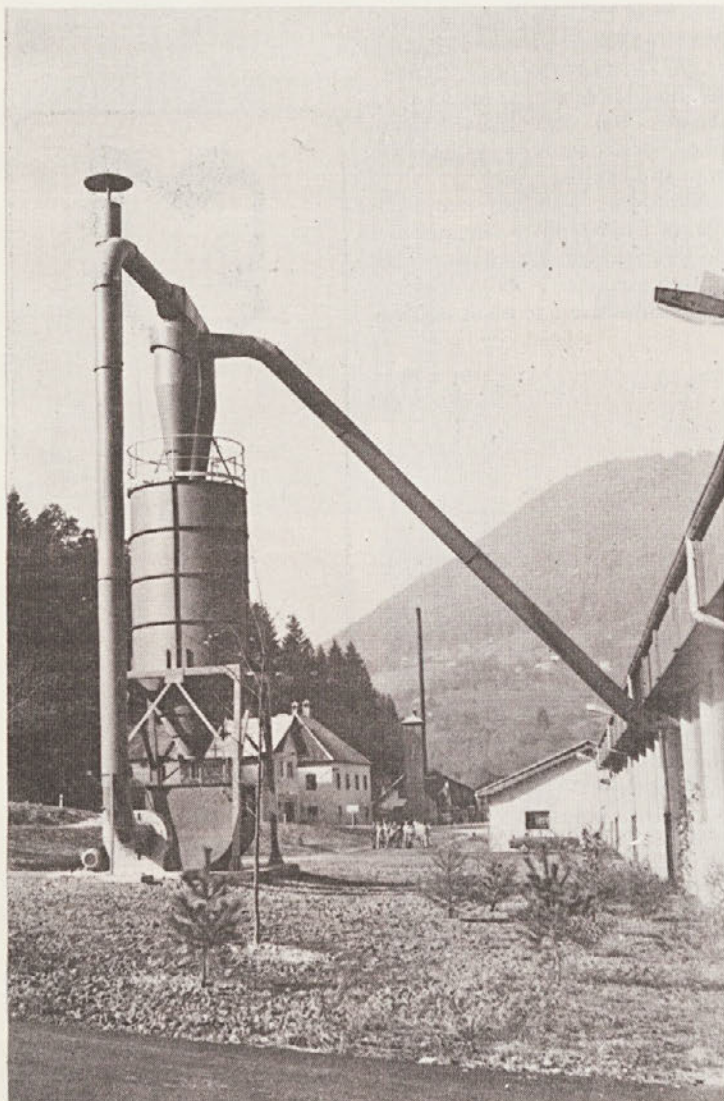
V preteklem letu je začel delati obrat plastificiranih predalov v Soteski.

– Velike nevšečnosti nam povzročajo prah. Posebno afriški les povzročajo pri obdelavi ogromno prahu. Zato bi bilo nujno urediti boljše prezračevalne naprave.