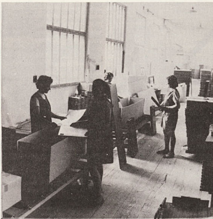
Ženska delovna sila daje pri nas velik del poslovnih uspehov.

Biološka funkcija materinstva je ženi določila vlogo, v kateri se bo vedno ločila od moškega. Tudi v bodoče bo usmerjala ženo k delovanju, kar pa nima nobene zveze z njeno borbo za enakopravnost in ne sme biti ovira pri njenem osebnem razvoju in družbeni udeležnosti.