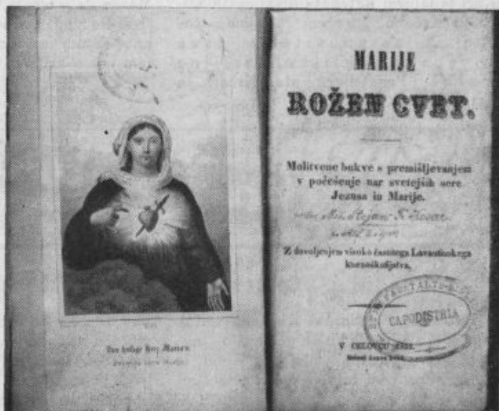
Marije Rožen cvet.

Trstenjak se je rodil 8. nov. 1817 v Kraljevcih pri St. Juriju ob Ščavnici. Za mašnika je bil posvečen 28. julija 1844 v Gradcu. Kapelanoval je v Slivnici pri Mariboru, v Ljutomeru, na Hajdini, v Ptuju in pri sv. Magdaleni v Mariboru, kjer je l. 1850 postal gimnazijski profesor za veronauk, slovenščino in zgodovino. Čez 11 let je šel za župnika pri