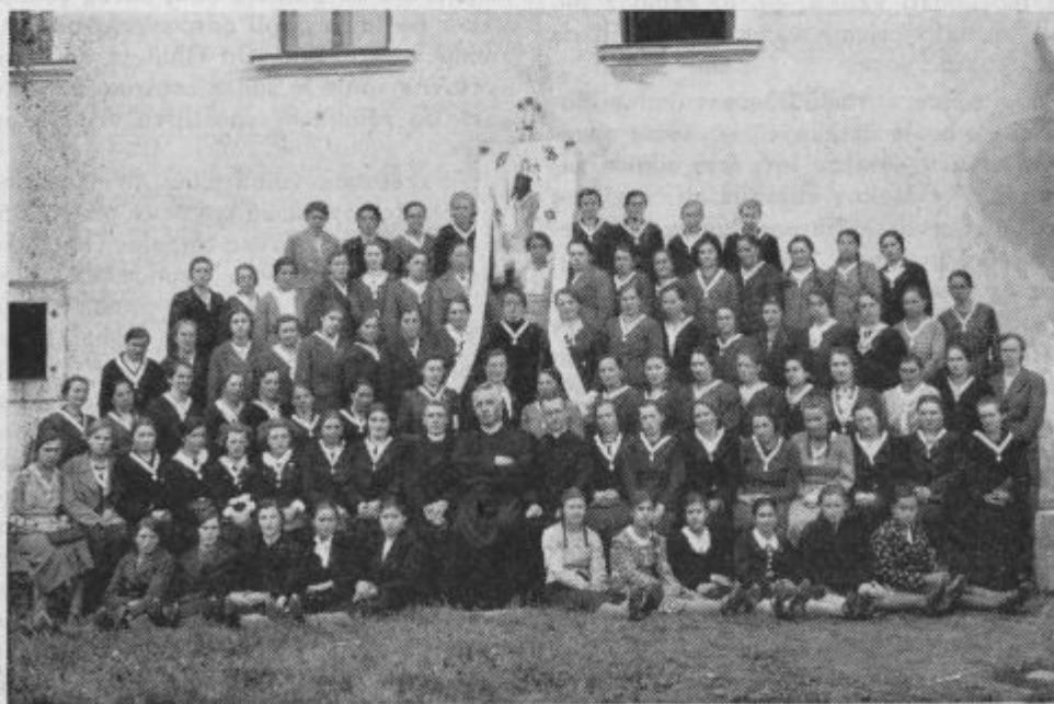
Dobrovska Marijina družba.

Da je v takih razmerah in ob bajni toploti 20 milijonov stopinj v srcu orjaškega sonca silno razburjenje, si je lahko misliti. Atomi vodika n. pr. v tej neznosni vročini blaznijo s hitrostjo 600 km v sekundi, drugi pa ne vedo, kaj bi začeli. Bolj sestavljena jedra težjih radioaktivnih atomov ob strahotnem bombardiranju odpirajo neizmerne žitnice energije, večje, kakor jih je zgradil egiptovski Jožef, in atomi ene vrste se spreminjajo v čisto druge prvine.