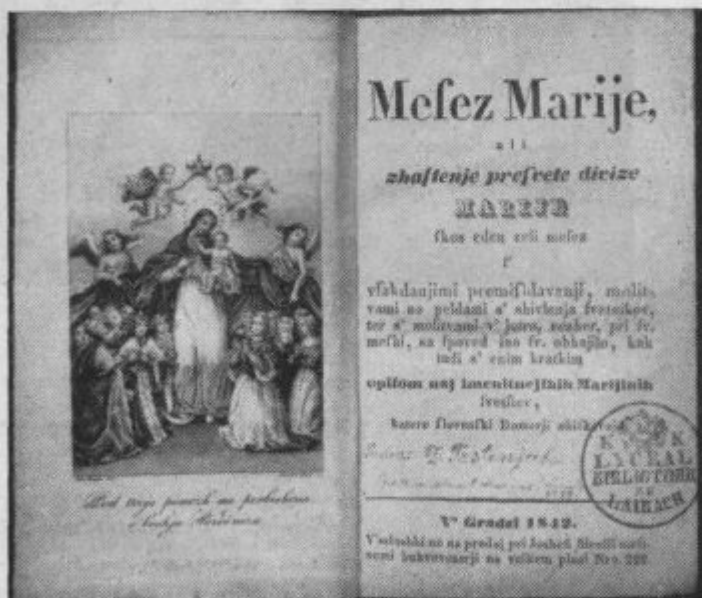
Mesez Marije ali zhaštenje presv. Divize. (Posl. dr. Trstenjak. V Gradzi 1842.)

Pod tem primernim imenom je šla prikupljiva majniška pobožnost od župnije do župnije. V pričetku so imeli pri nas »Šmarnice« le ob nedeljah meseca majnika, sčasoma so jih pa uvedli za vse dni. Prvikrat so v ljubljanski stolnici praznovali vsakdanje Šmarnice l. 1856, kar priča napis, vklesan v marmornati