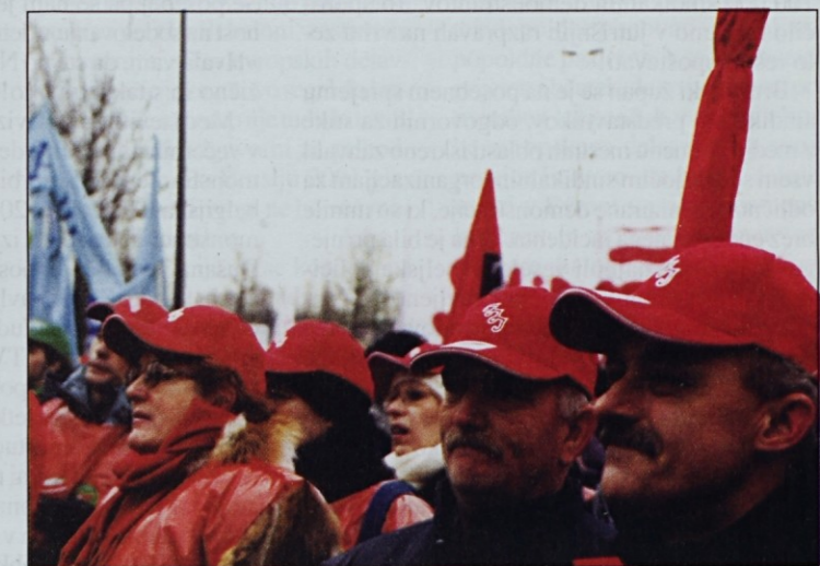
Med demonstranti je bilo tudi več Ptujčanov.