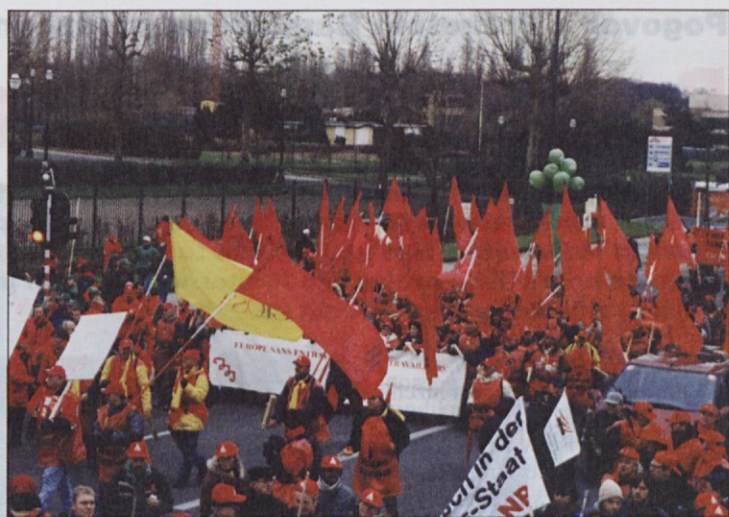
Naša skupina prihaja pred stadion Roi Baudouin (nekdanji Heysel).

nilcev družin, ki ima velik socialni vpliv in moč. Takšnih, ki bi prišli na demonstracije zaradi veseljačenja, in vinjenih ni bilo opaziti. Sami resni obrazi in resni pomenki. Atmosfera pred demonstracijami še zdaleč ni bila podobna tisti na sindikalnih izletih, udeleženci so dali videz ljudi na resni in odgovorni službeni poti.