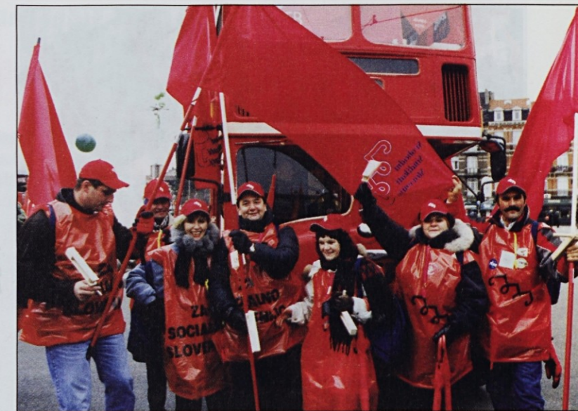
Dolenjci so hoteli biti še bolj rdeči, zato so pozirali pred avtobusom.

ristnimi pomenki in izmenjavo izkušenj. Naporno, vendar prijetno potovanje so za nekaj minut prekinili samo nemški policisti, ki so okoli dva kilometra pred belgijsko mejo temeljito prekontrolirali vse skupine, namenjene v Bruselj, saj so želeli