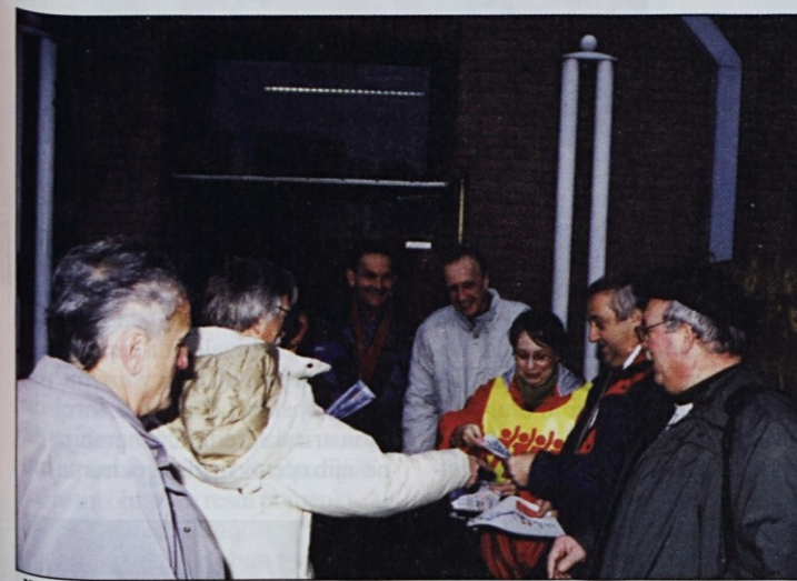
Že zjutraj je naše šefe obiskala predstavnica EKS in se z njimi dogovorila o zadnjih podrobnostih.

začelo že v torek zvečer, ko sta iz Murske Sobotne krenila na pot dva avtobusa. Na poti do Ljubljane sta »pobraba« sindikalne zaupnike iz Pomurja, Podravja, Ptujca, Celja in Koroške, pred sedežem ZSSS na Dalmatinovi 4 pa so se jim pridružili še sindikalisti iz Ljubljane in drugih delov Slovenije. Nato so oboroženi z rdečimi zastavami, ogrinjali, transparenti, kapami, piščalkami, ragljami in z malico za tri dni v treh avtobusih sredi noči s torca na sredo krenili na okoli 1300 kilometrov dolgo pot proti Bruslju. Pot preko Avstrije in Nemčije do glavnega mesta Belgije in nove prestolnice Evropske unije, ki je skupaj s postanki trajala 18 ur, so si popestrili s prepevanjem in pripovedovanjem šal, pa tudi s ko-