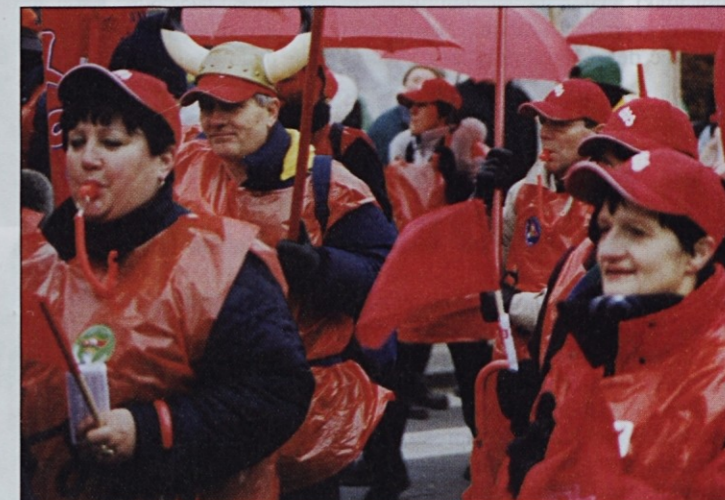
Dekleta so uporabila tudi piščalke.

začelo že v torek zvečer, ko sta iz Murske Sobotne krenila na pot dva avtobusa. Na poti do Ljubljane sta »pobraba« sindikalne zaupnike iz Pomurja, Podravja, Ptujca, Celja in Koroške, pred sedežem ZSSS na Dalmatinovi 4 pa so se jim pridružili še sindikalisti iz Ljubljane in drugih delov Slovenije. Nato so oboroženi z rdečimi zastavami, ogrinjali, transparenti, kapami, piščalkami, ragljami in z malico za tri dni v treh avtobusih sredi noči s torca na sredo krenili na okoli 1300 kilometrov dolgo pot proti Bruslju. Pot preko Avstrije in Nemčije do glavnega mesta Belgije in nove prestolnice Evropske unije, ki je skupaj s postanki trajala 18 ur, so si popestrili s prepevanjem in pripovedovanjem šal, pa tudi s ko-