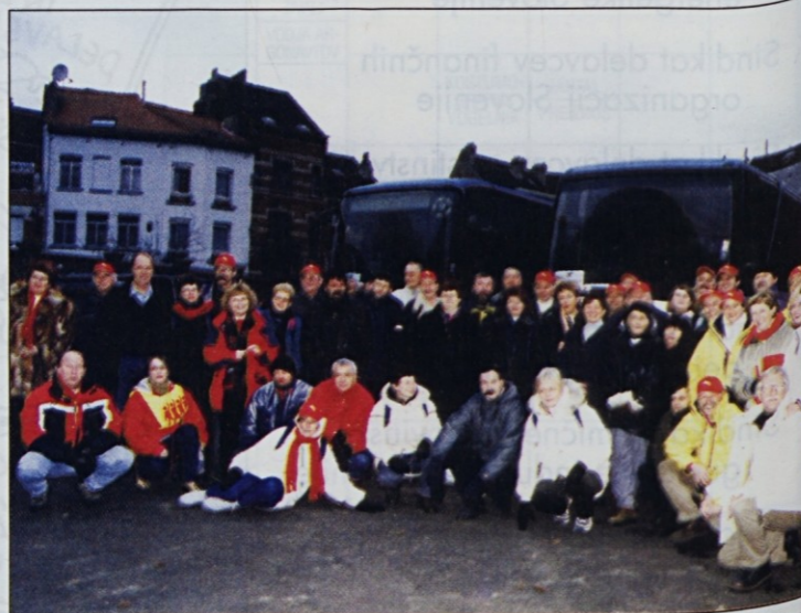
Jedro demonstrantov se je želelo slikati že v jutranjem mraku pri mladinskem hotelu.

Potovanje zaupnikov in funkcionarjev Svobodnih sindikatov na demonstracije v Bruselj se je