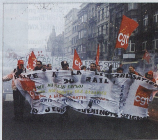
Za nami so šli francoski sindikalisti s skoraj pravim ognjem.