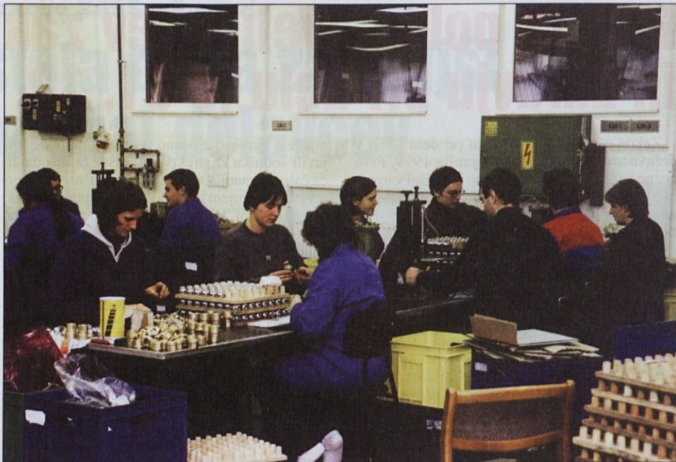
Kovina je majhno podjetje, ki se na trgu srečuje s hudo konkurenco. Konkurenčnosti ne ohranja z nizkimi cenami, ampak s kakovostjo, ki je njen adut.

Z notranjim lastništvom ni nič narobe. Naš primer dokazuje, da notranji lastniki znajo skrbeti za dolgoročni obstoj podjetja, da ne podlegajo trenutnim koristim, ki bi jih imeli od višjih plač. Naše podjetje ima prihodnost, tega se za-