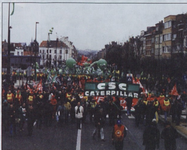
Na čelu kolone so bili belgijski kovinarji, njihova barva je zelo zelena.

Ob 13.30 uri, ko je kolona demonstrantov začela dva kilometra dolg pohod po bulevarju Emile Bockstael in aveniji Houba De Strooperja, so zabrnele kamere na desetine televizijskih snemalcev in fotoreporterjev. Na čelu kolone so bili belgijski kovinarji, za njimi so korakali belgijski sindikalisti, na tretjem mestu v koloni pa je bila maloštevilna, ven-