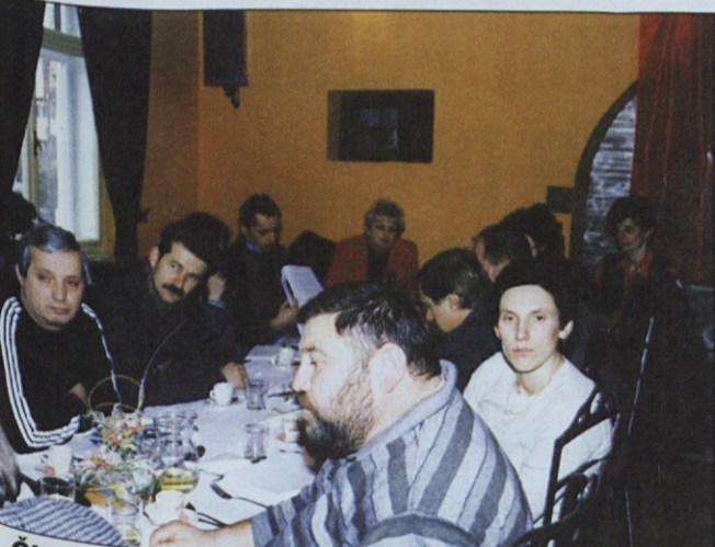
Člani konference so podprli usklajeni predlog zakona o delovnih razmerjih in se zavzeli za to, da bi ga državni zbor čim prej sprejel.