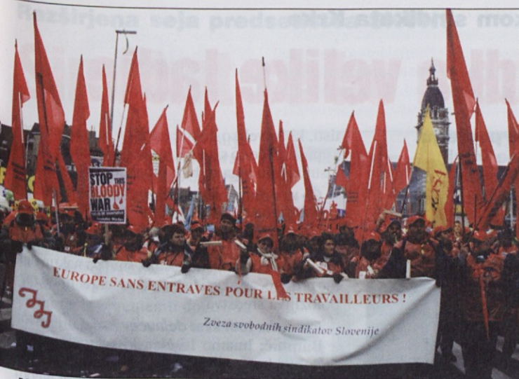
Na tej fotografiji naj bi bilo jedro naše skupine.