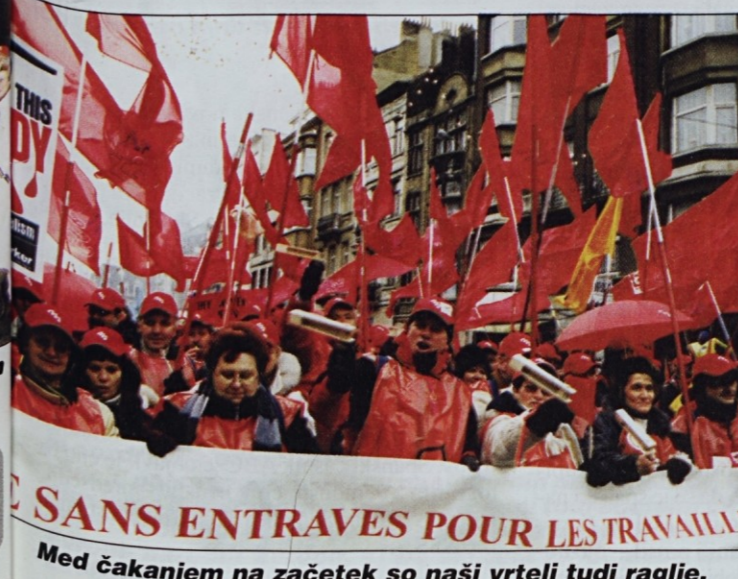
SANS ENTRAVES POUR LES TRAVAILLEURS Med čakanjem na začetek so naši vrteli tudi raglje.