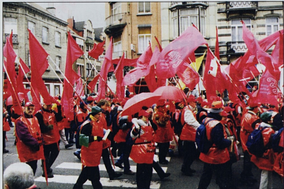
Takole je naša četica odkorakala s Trga Emile Bockstael.

Evropska konfederacija sindikatov (EKS) je tudi letos pred zasedanjem vrha Evropske unije v Laeknu v Bruslju pripravila množične demonstracije za socialno Evropo in za okrepljen socialni dialog v njej. Z demonstracijami, na katerih se je zbralo okoli 100.000 sindikalistov in delavcev