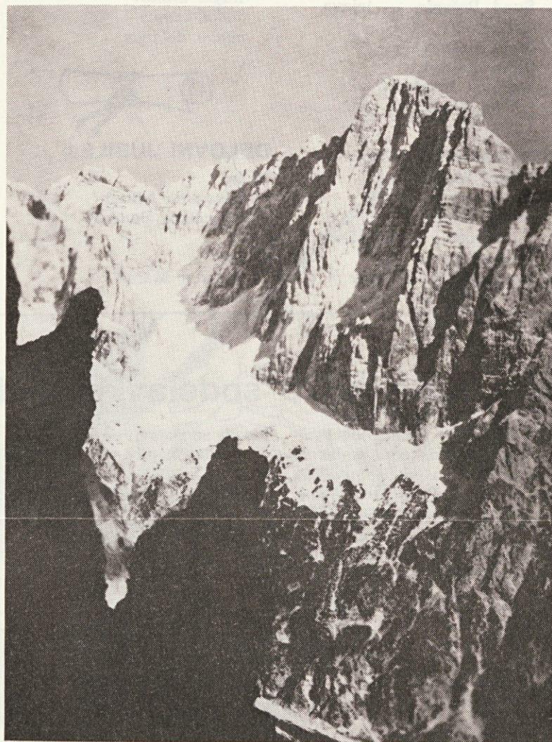
Pogled na Škrlatico

Zjutraj ob štirih sva že stopila iz kočice v lepo noč, posuto z zvezdami. Dokaj temno je še bilo, tako da sva uporabljala svetilke še celo uro. Slišala sva slap pod Razorjem in ko se je zdanilo, sva zagledala osamljenega gamsa ravno ko je prečkal melišče in zajca — ta se med skalami sploh ni hotel premakniti. Sam vzpon preko Kriške stene je dokaj razgiban, manjka že precej klinov, je pa edinstven po tem, da skoraj nikogar ne srečaš. Ko sva prispela na vrh te stene, naju je sonce prijetno pobožalo; bil je čas, da malo prigrizneva. Slikal sem vso to lepoto, ki mi je bila podarjena. Nato sva se spustila malo niže in prišla na stezo, ki vodi na Kriške pode in naprej proti Dolkovi špici. Tu je prelep razgled na Škrla-