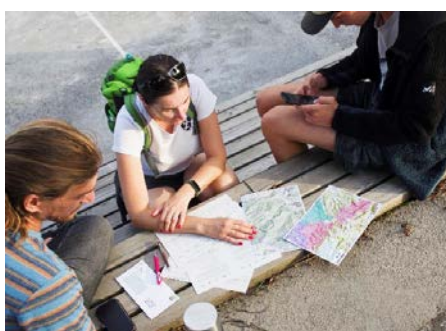
Na zbirnem mestu se prostovoljci razdelijo v terenske ekipe.