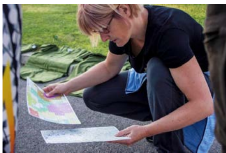
Vsaka ekipa je zadolžena za popis 4-5 kvadrantov.