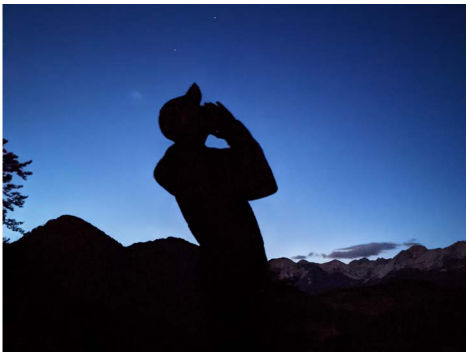
Na vsakem popisnem kvadrantu eden izmed terenske ekipe izvede serijo tuljenj. (foto: Nika Perinčič)

Želimo se zopet zahvaliti vsem vpletenim v organizacijo in izvedbo popisa. Tako delo članov društva kot vas popisovalcev je prostovoljno. Zavedamo se, da sodelovanje pri popisu zahteva veliko mero iznajdljivosti, prilagajanja in požrtvovalnosti. Zelo cenimo vašo pomoč pri izpeljavi in upamo, da bomo sodelovali tudi v prihodnje. ✨