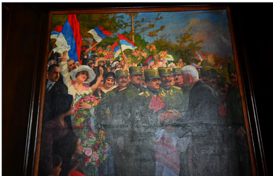
Monumentalni sliki "Proglasenje Kraljevine SHS", edina slika "ujedinjenja" (združitve) jugoslovanskih narodov v Kraljevino Srbov, Hrvatov in Slovencev 1. decembra 1918, in slika "Doček Kralja Aleksandra" 26