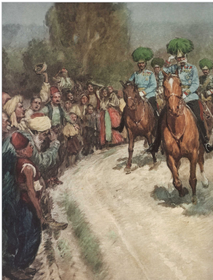
Franc Jožef paradira pred četami v Sarajevo 1. junija 1910, del slike Ludwiga Kocha ( Viribus Unittis. Das Buch vom Kaiser (Dunaj, 1989); glej tudi Der Ewige Kaiser. Franz Joseph I. 1830–1916 (Dunaj, 2016), str. 116) 12

da so tehnike omejene na tedanji razvoj, predvsem skrbno naslikane portrete in fotografije ter panegirične zapise, ki gredo od zibelke in zgodnjega otroštva do junaških dejanj, porok, državniških srečanj in drugih dogodkov.