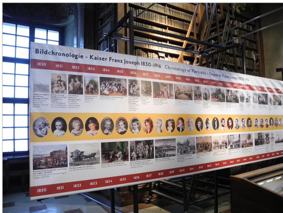
Začetni del kronologije v slikah Franca Jožefa na razstavi Der ewige Kaiser. Franz Joseph I. 1830–1916, Österreichische Nationalbibliothek, 2016 9

v monarhiji " Herrenvolk "). Ti so iz njega, a tudi drugih Habsburžanov naredili znamko, s katero služijo stotine milijone evrov. Leta 2016, ob 100-letnici smrti, je tako Avstrija ponorela za "večnim cesarjem" Francem Jožefom. Posvetila mu je celo leto, polnil je časopisne članke, elektronske in druge medije, socialna omrežja. Postavili so pet velikih razstav, od tega prvo, osrednjo Der ewige Kaiser v elitni Österreichische Nationalbibliothek (ki sicer hrani več kot 10.000 dokumentov in fotografij o "kajzerju" in Habsburžanih), drugo pa v od turistov obleganem Schönbrunnu ( Mensch und Herrscher ). V koordinaciji Schönbrunna z drugimi muzeji so nastale še druge. Glamur: obleke, kočije in podobne zadeve ( Repräsentation & Bescheidenheit ) v Kaiserliche Wagenburg in pohištvo, rituali, vsakdanjik ( Fest & Alltag ) v Möbelmuseum Wien.