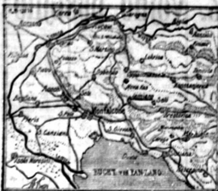
— Zur italienischen Niederlage bei Mantova.

Iz uradnih poročil so naši čitatelji razvidili, da so italijanski Italijani pri Jamianju doživeli veliki in krvavi poraz. Bili so grozovito tepeni. Z ozirom na te za naše čete zmagovite boje prinašamo zemljevid dotičnih pokrajin.