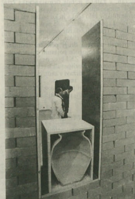
V Beneški hiši v Milihi je odprta razstava mladih slovenskih umetnikov z naslovom Galaxia.

To bi bil najbrž tudi konec zasedanja 17. seje CK ZKJ, ki je spravila - tako mimogrede - pokonci velik del sveta, če ne bi bilo na koncu na dnevnem redu še glasovanja o zaupnici vodstvu. Paсти, ki se je skrivala v tem glasovanju, najbrž prvi hip niso vsi dobro razumeli, kajti drugače ne bi tako ravnodušno opazovali dogajanja okrog sebe. Toda, ko