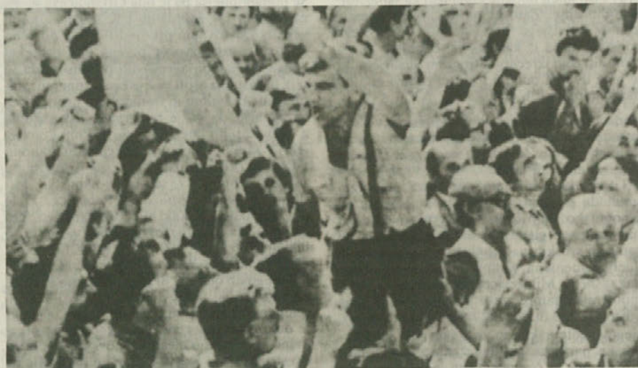
30 tisoč Srbov in Črnogorcev je demonstriralo v Titogradu.