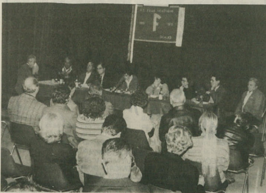
Prejšnji teden je imelo občni zbor tudi kulturno društvo Venturini od Domia.