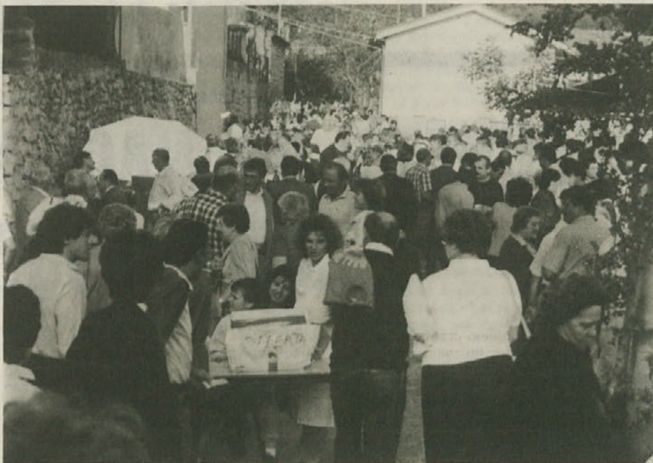
Sredi meseca so imeli uspel vaški praznik v Gročani, kjer so tudi odprli razstavo kmetijskega orodja.