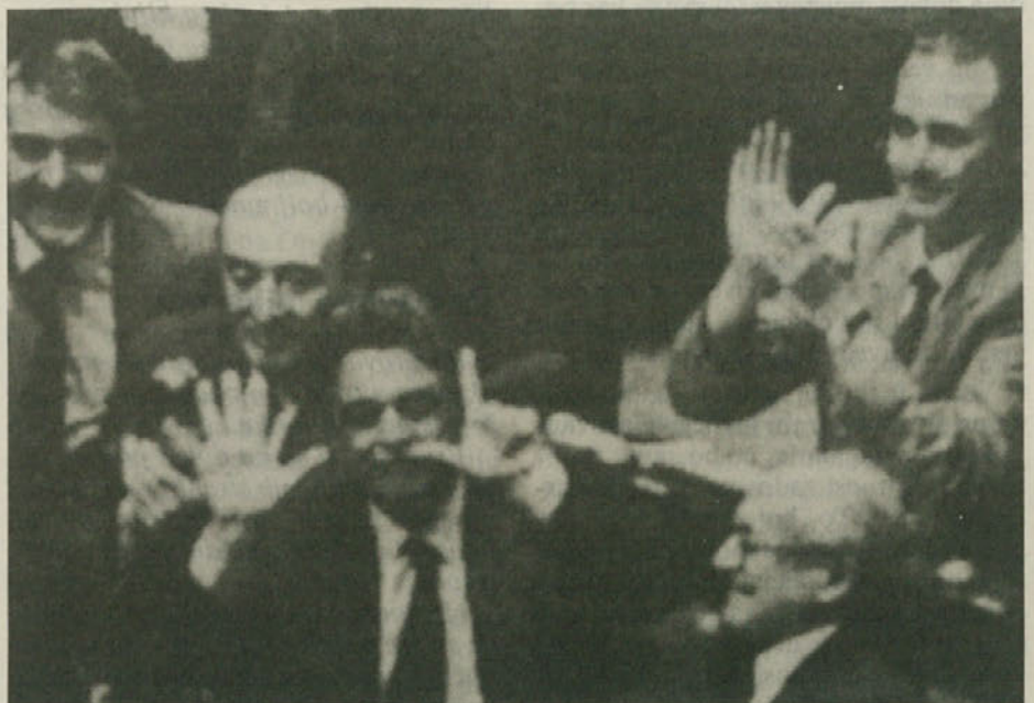
Tovariši Zangheri, Occhetto in Napolitano v avli po objavi rezultata glasovanja.