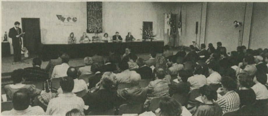
Občni zbor ZSKD v občinski dvorani v Špetru.