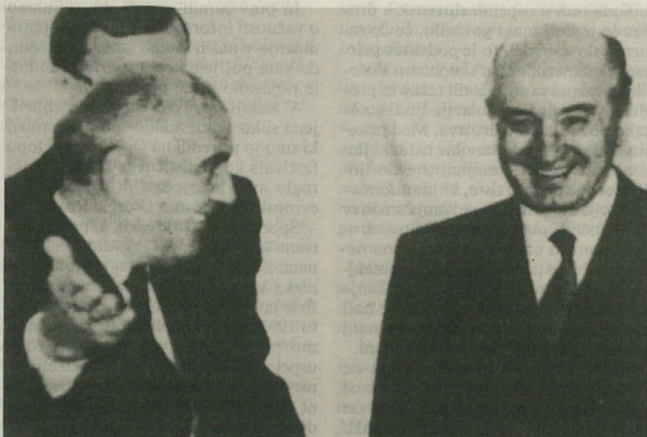
Glavni tajnik sovjetske partije Gorbačov z našim ministrskim predsednikom De Mito. Prihodnje leto bo Gorbačov obiskal našo državo.