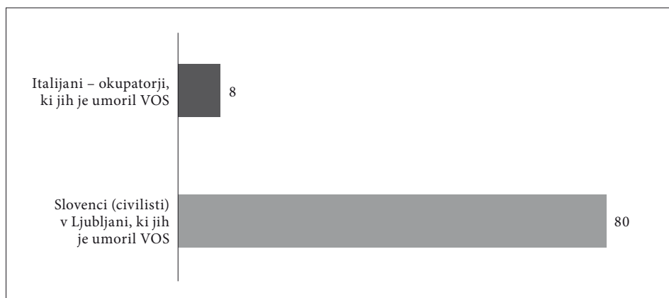
Graf 3: Narodna pripadnost žrtev revolucionarnega nasilja v Ljubljani znotraj bodeče žice (julij 1941–oktober 1942)

Za primerjavo naj navedemo, da je revolucionarna stran v tem času na istem območju umorila okoli 80 Slovencev.