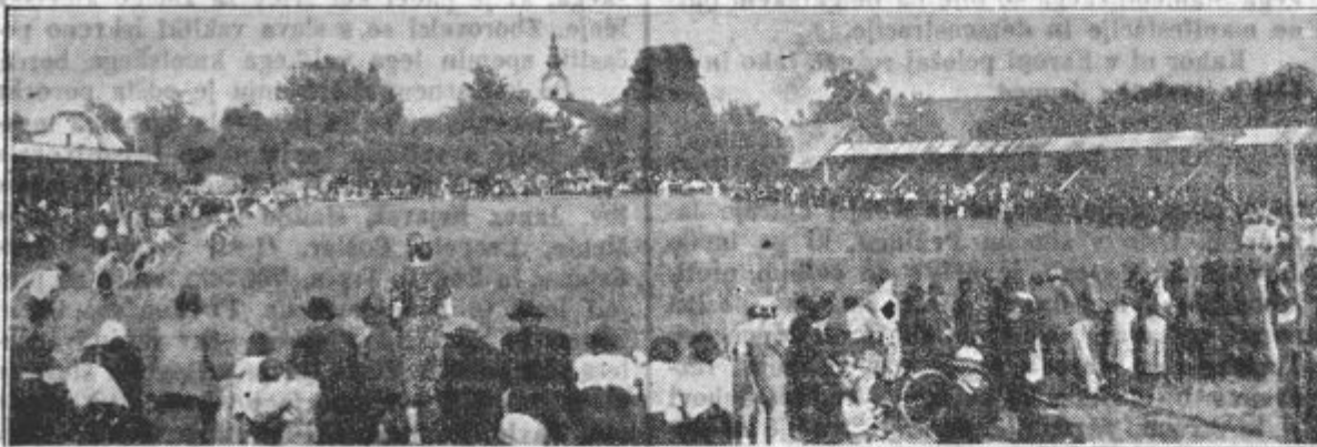
Prizor s tekme koscev, ki se je vršila v Vogljah na Gorenjskem v nedeljo dne 7. junija.