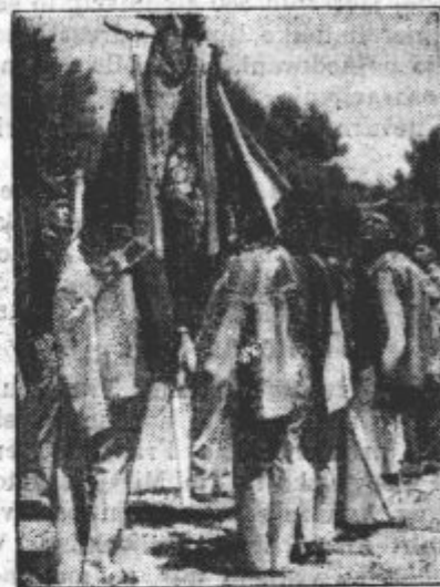
Pobratinstvo sokolskih praporov z zastavo, ki jo je podaril našemu Sokolu mladi kralj Peter II.

biti z Anglijo v smislu tako zvane »streške fronte« vesil in s tem za popuščanje v abesinski zadevi, ali pa za še večjo popustljivost v zvezi z Nemčijo in drugimi »nezadovoljnimi« državami. Težko je že sedaj reči, v katero smer bo krenila italijanska zunanja politika. Francoski poluradni »Temps«, čigar dopisnik ima najboljšo zvezo z italijanskim zunanjim ministrstvom, je mnenja, da je Mussolini bolj za prvo kakor za drugo pot, vendar pa da ni izključeno, da se z nemško rezervo že sedaj zavaruje proti morebitnim presenečenjem. Zanimivo je, da nemško