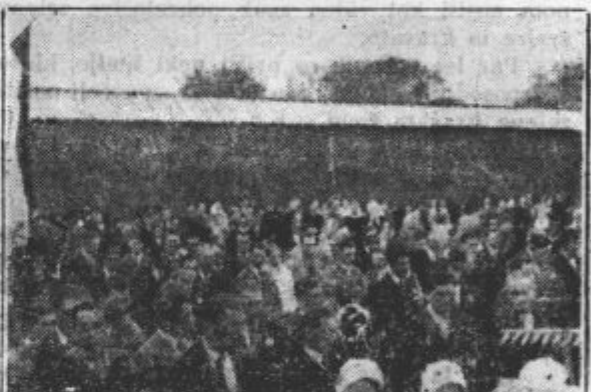
Pred začetkom tekme je bila odigrana pred odkrito kmetško množico državna himna.