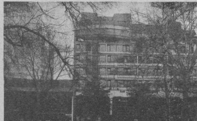
Pročelje Cankarjevega doma ni več zakrito z gradbenimi odri; takšna je njegova podoba s severne strani