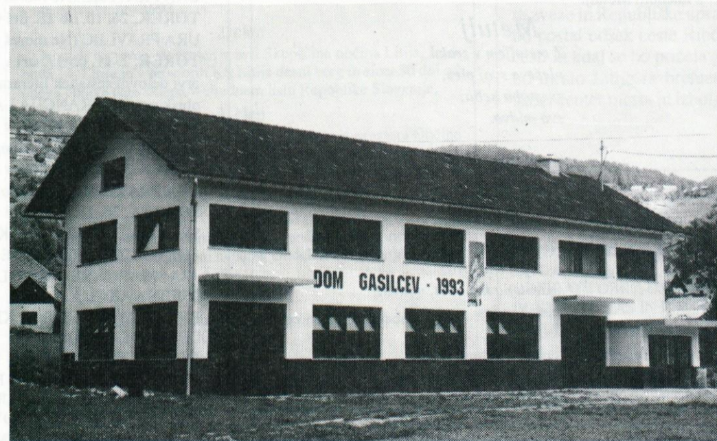
K lepšemu izgledu našega doma je svoje prispeval tudi soboslikar Ferlan, ki je na fasadi izdelal fresko zavetnika gasilcev sv. Florjana.