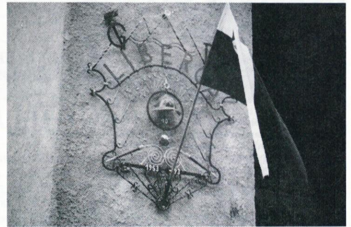
Zamisel in izdelava gasilskega emblema je delo našega zdomca FRANCETA POGLAJEN-a - DOBLJANOVEGA iz Nemčije.