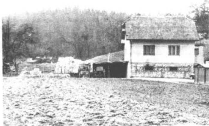
Ja, on lahko, sosede pa ne