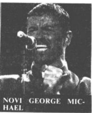
NOVI GEORGE MICHAEL

stal njen prvi »pop star« prijatelj...YO... Čeprav je M. C. HAMMER večja rap zvezda, vsaj tako trdijo tisti, ki na tem področju delijo nagrade, pa VANILLA ICE nikakor noče zaostajati in je tako iz svojega glasbenega prvenca izdal že tretjo uspešno z imenom I Love You ...YO... Projekt JIVE BUNNY-MASTER-MIXERS je v začetku letošnjega leta izdal svoj drugi LP, dobre tri mesece kasneje pa že novi hit: Over To You John ...YO... Kako dobra stara štanca propada je opa-