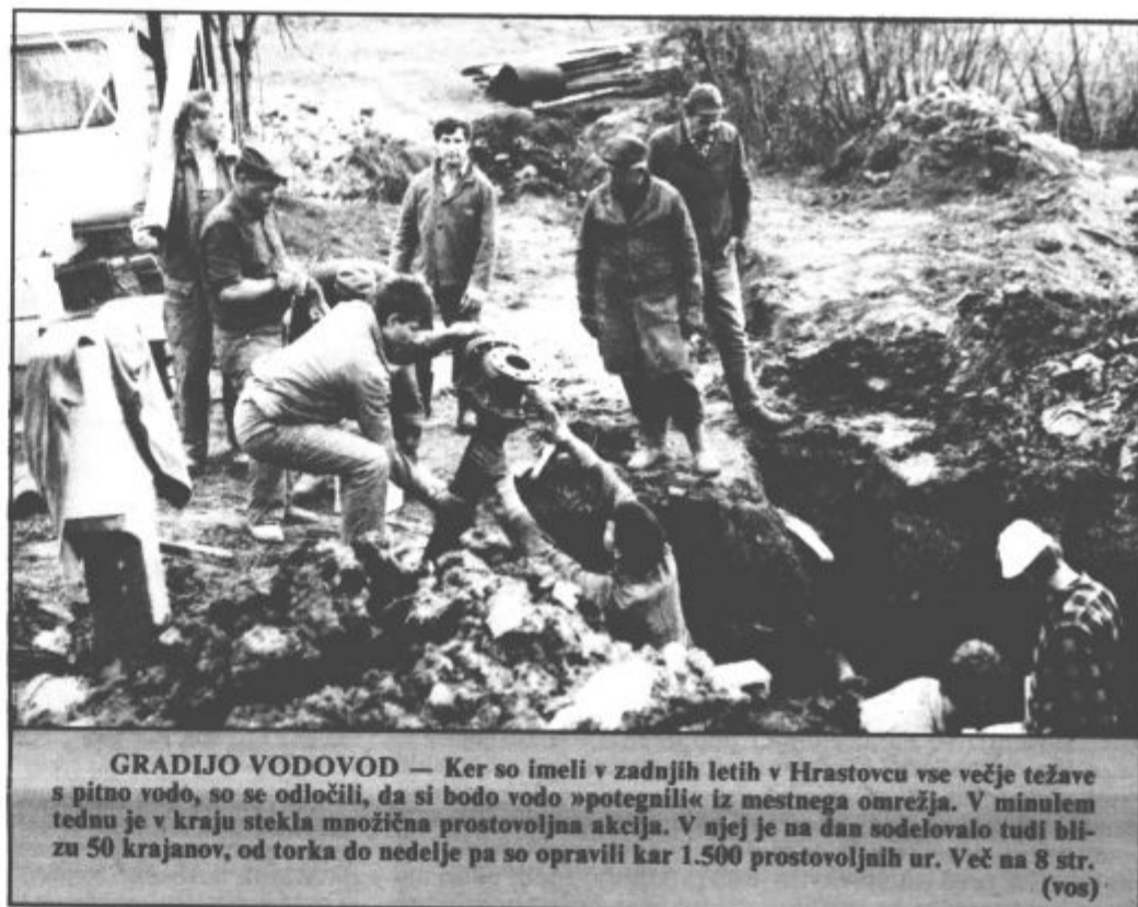
GRADIJO VODOVOD — Ker so imeli v zadnjih letih v Hrastovcu vse večje težave s pitno vodo, so se odločili, da si bodo vodo »potegnili« iz mestnega omrežja. V minulem tednu je v kraju stekla množična prostovoljna akcija. V njej je na dan sodelovalo tudi blizu 50 krajanov, od torika do nedelje pa so opravili kar 1.500 prostovoljnih ur. Več na 8 str. (vos)

V soboto je bila v Velenju prva konferenca ZSSS