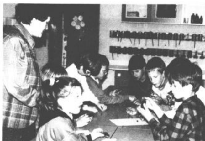
Učenci tretjih razredov pri uri dopolnilnega pouka — tokrat o magnetu.