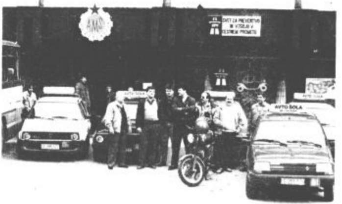
Za uspešno učenje kandidatov so potrebna tudi sodobna vozila, ki jih na AMD imajo