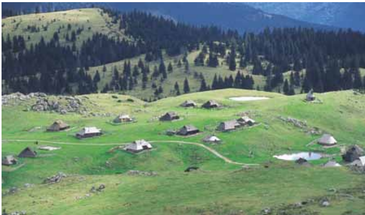
Vlasto Kopač se je zelo trudil, da bi Velika planina ohranila svojo prvotno arhitekturo. Žal moderni časi starozitnosti niso naklonjeni.