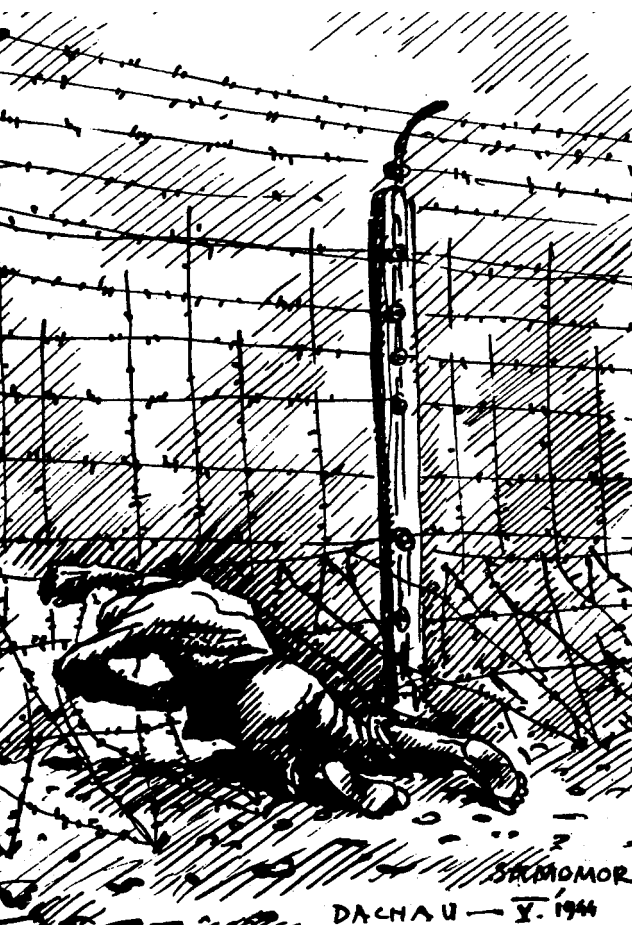
Samomor jetnika na električni taboriščni ograji (perorisba, 1944)