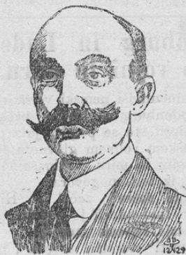
Dr. Jan Kucharzewski.

Dosedanji kronski referendar regentskega sveta Poljske dr. Jan Kucharzewski, katerega