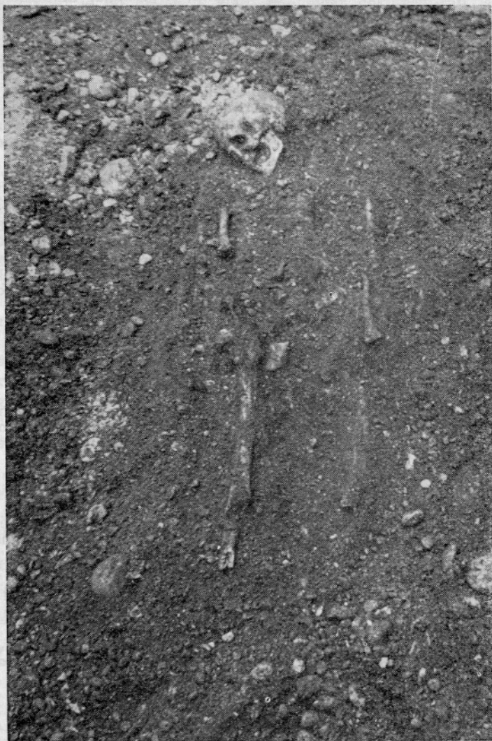
Sl. 2. Ljubljana, Komenskega ulica. Grob 1 Fig. 2. Ljubljana, Komenskega ulica. Tombe 1