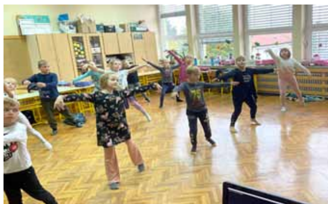
► SLIKE 14, 15 in 16:: Aktivnosti na temo razvijanje zdrave samopodobe