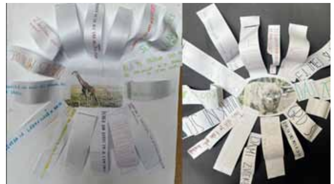
► SLIKI 5 in 6: Jezik žiraf in volkov: učenci skozi igro vlog spoznavajo razliko med nasilno in nenasilno komunikacijo (YouthStart, Moja čustva – tvoja čustva: jezik žiraf in YouthStart, Vreča prijateljstva).

potrebam razreda. V 4. stolpec po opravljenih aktivnostih učitelj zapiše kratko refleksijo, na primer odziv učencev, morebitne pozitivne ali negativne učinke ob izvedbi aktivnosti ali dileme.