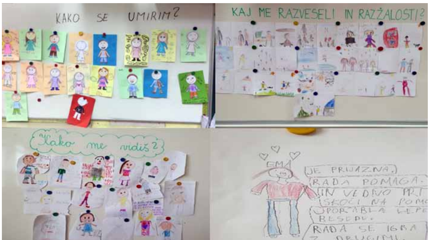
► SLIKA 7: Razstave učencev razredne stopnje iz priročnikov abced.si (Pozitivna psihologija in pozitivna edukacija, 2023), priročnikov za socialno in čustveno učenje s pomočjo likovne umetnosti Ferdo se uči o sebi in drugih (Batič in Košir, 2020). Na predmetni stopnji učitelji posegajo tudi po priročniku za razvijanje socialnih in čustvenih veščin ter samopodobe Zorenje skozi To sem jaz (Kontrec Jurčič idr., 2019).

Novembra in decembra po vertikali ozaveščamo čustveno in socialno pismenost s prepoznavanjem, odzivanjem in uravnavanjem čustev ter občutkov. »Nikoli ni prezgodaj, da se otroci naučijo vživljati v druge ljudi in z drugimi ravnati na bolj sočuten način. Učenci se morajo najprej naučiti izražati lastna čustva in potrebe, šele nato bodo