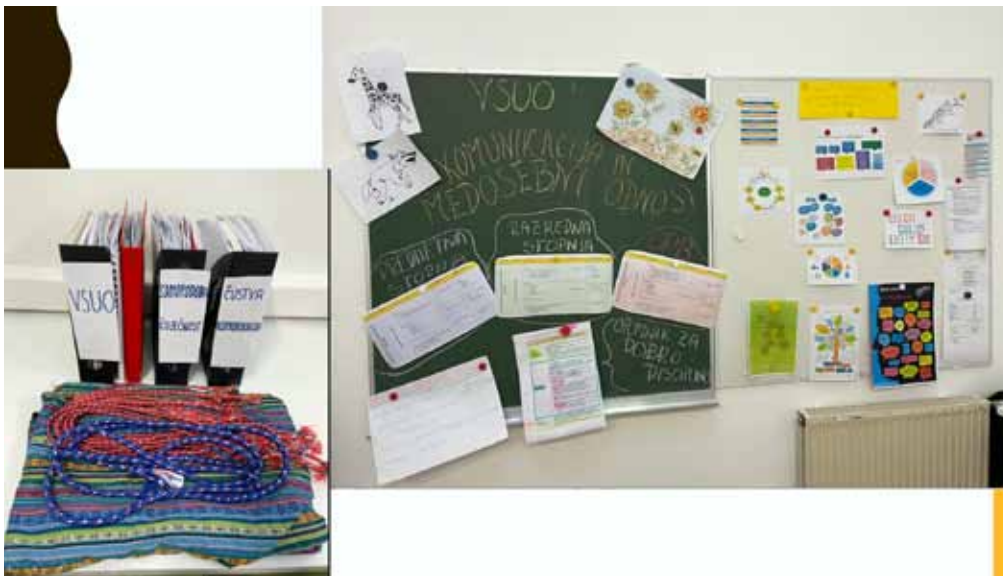
► SLIKA 1: Kotiček varnega in spodbudnega učnega okolja v zbornici ter oglasna deska z vodilno temo in mesečnimi opomniki

Sistematično se simulacije izvajanja VSUO na naši šoli lotimo tako, da si strokovni delavci na podlagi strategije (Slika 3) v začetku šolskega leta avtonomno oblikujejo »osebne načrte« in jih vključijo v letno delovno pripravo. Osebni načrt učitelja je t. i. »živ dokument«, ker se aktivnosti tekom leta prilagajajo potrebam v razredu, delavnice se lahko zamenjajo, izpustijo ali dodajo. Po opravljenih aktivnostih učitelji v preglednico vpišejo še kratko refleksijo o odzivih učencev, o pozitivnih ali negativnih učinkih delavnic, prav tako zapišejo morebitne dileme (Slika 4).