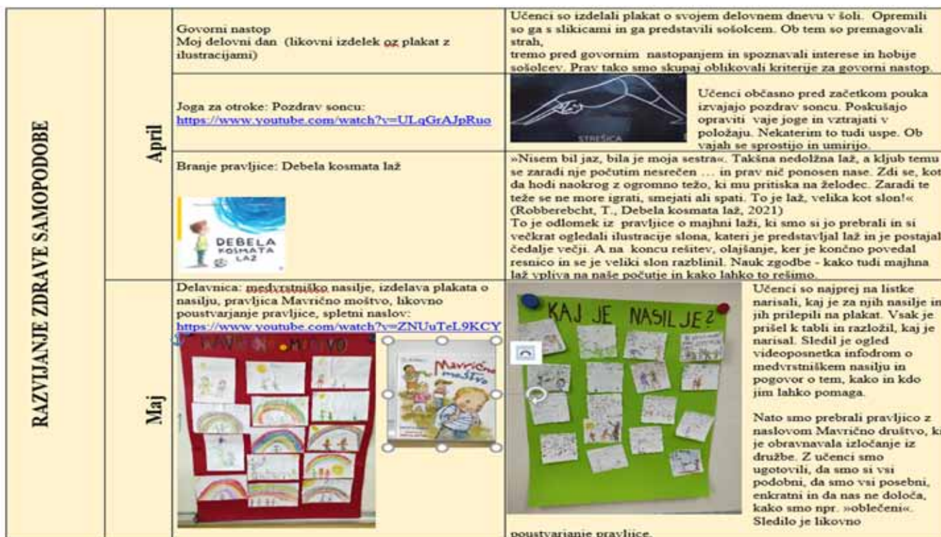
▶ SLIKA 19: Osebni načrt učiteljice z refleksijo za vodilno temo razvijanje zdrave samopodobe

YouthStart, Vreča prijateljstva http://www.youthstart.eu/si/challenges/mutual_understanding_giraffe_tool_box/