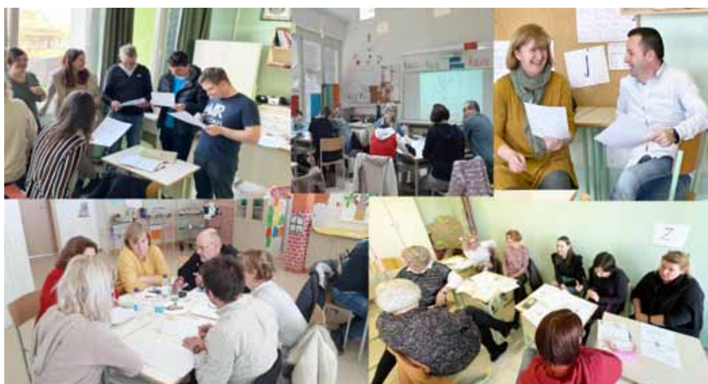
► SLIKA 12: Delavnice VSUO za učitelje na strokovnih sejah, izobraževanjih in aktivih