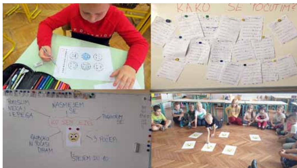
▶ SLIKA 8: Osebni načrt učiteljice z refleksijo za vodilno temo čustveno opismenjevanje