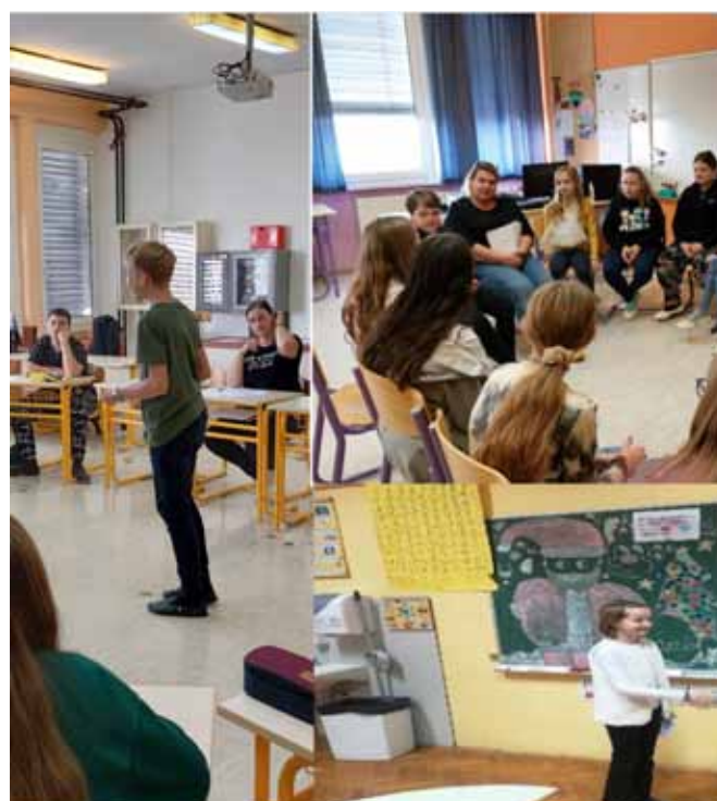
► SLIKI 10 in 11: Utrinki aktivnosti na temo komunikacija in medosebni odnosi