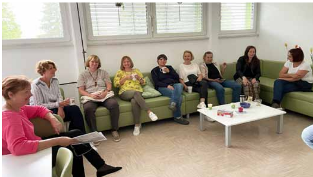
► SLIKA 13: Zbornica zgodaj zjutraj

jutro se zberejo v zbornici ob sproščnem klepetu ipd. Izbrane vsebine učitelji prenašajo tudi v razred z vizualizacijo, čuječnostjo, izvajanjem tehnike sproščanja, dihanja, plesanja, poslušanja umirjene glasbe ipd.