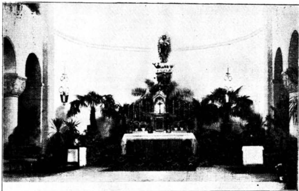
Prezbiterij cerkve sv. Jožeta v Ljubljani.

Pa še eden temu nasproten zgled! V fari se je ustanovila Marijina družba in dekleta neke velike vasi so izključno vse vanjo pristopile. Ena pa, ki je bila tudi tega mnenja, da se v Marijini družbi ne more možiti, se je hitro skesala in je iz- stopila prostovoljno. Zaročila se je z ne- kim mladeničem. Bilo je cerkveno žegna- nje in z njim običajni ples. Fantje so de- kleta, kot vsako leto, vabili. A letos pa deklet ni bilo. Prišla je le sama odpad-