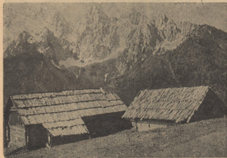
V SLOVENSKE PLANINAH