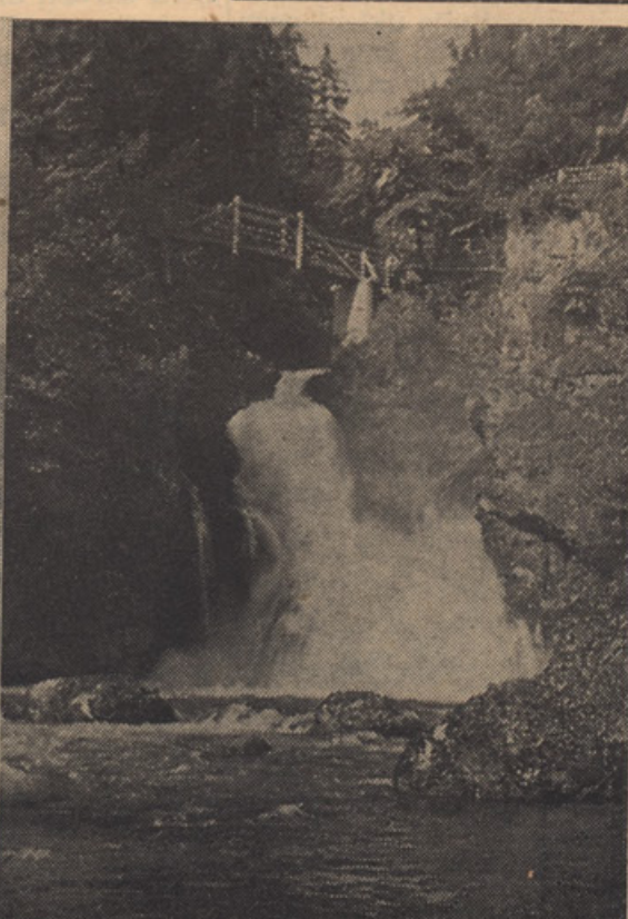
SLAP ŠUM NA KONCU DOLINE VINTGAR...