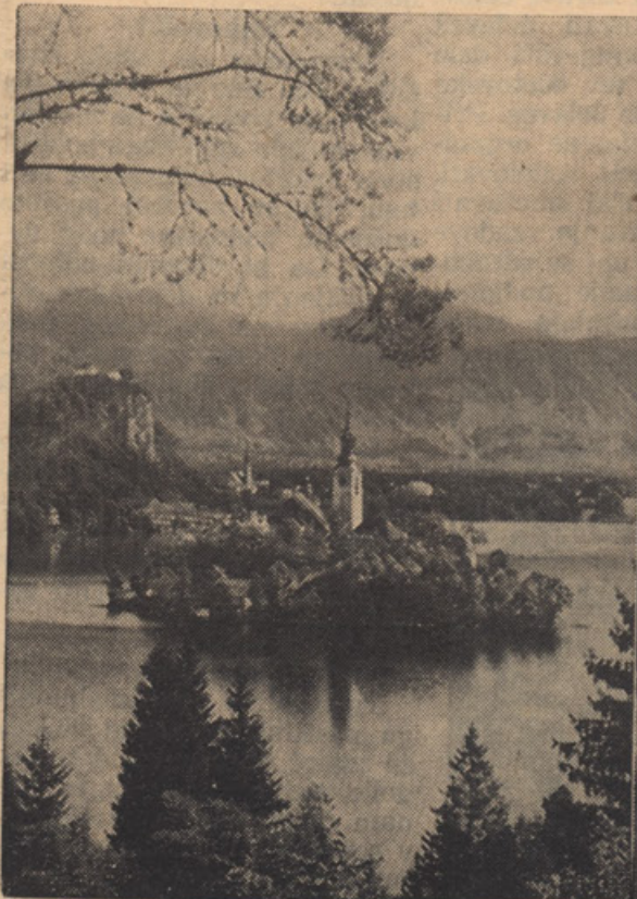
OTOK BLEŠKI KINC NEBEŠKI...