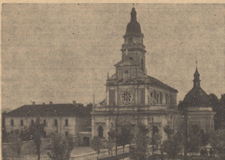
MARIJA POMAGAJ NA BREZJAH. SLOVENSKA NARODNA BOŽJA POT.

The National Geographic Magazine, June 1939, 695