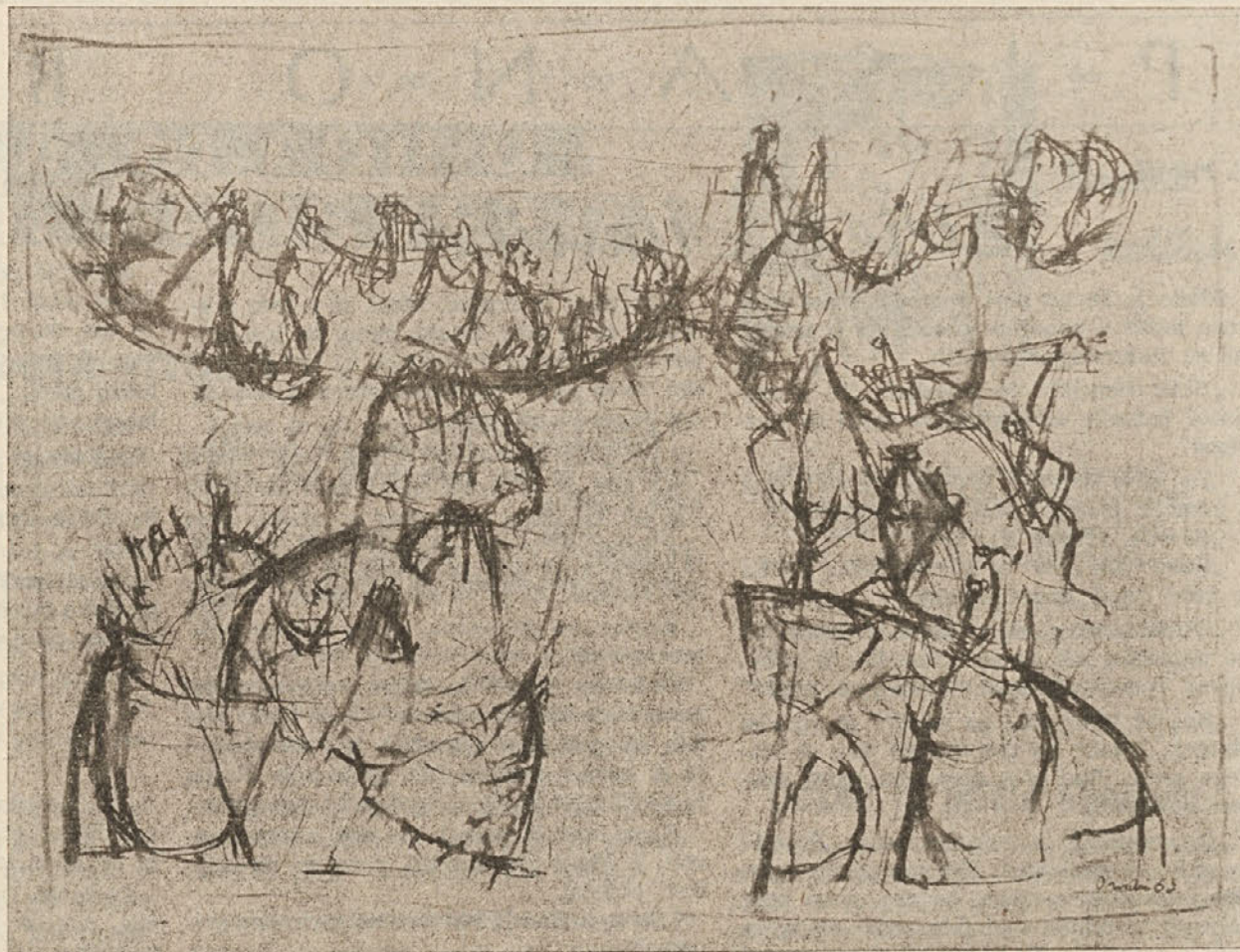
LJUDJE (grafika s črno kredo)

tankosti njegovih slik, ki jih razstavlja v „Galeriji 61“, potem bi bilo mudi se z vsako natančneje baviti in si jo dalj časa ogledovati. Predvsem pa bi se morali bolj natančno poučiti s podrobnim študijem o abstraktni, tonski slikarski umetnosti, da bi lahko razumeli moderno, sodobno slikarstvo.