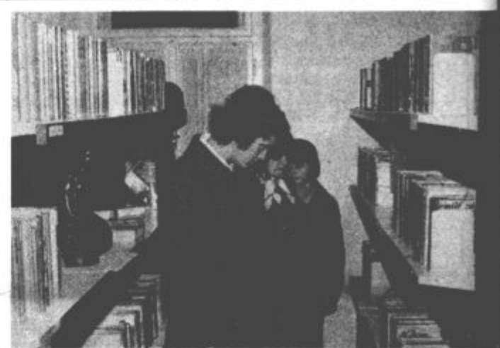
Po otvoritvi so si krajani z zanimanjem ogledali prostore nove knjižnice.

mogoče izposojevati. Knjižnica je sicer dolga leta uspešno delovala pod okriljem kulturnega društva, zaradi prostorskih težav pa je ta dejavnost pred časom povsem zamrla. Da bi nadaljevali dolgoletno tradicijo, so krajevni skupnosti priskočili na pomoč Občinska kulturna skupnost Velenje in Kulturni center Ivan Napotnik Velenje. Adaptirali so prostore bivše zdravstvene postaje, jih sodobno opremlili, obogatili in obnovili knjižno zbirko ter lepo