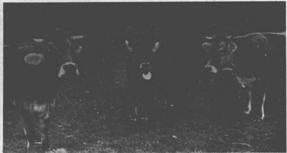
Nujna bo usmeritev v vzrejo plemenske in klavne govede

Tako zastavljen razvoj mora zagotoviti večji dohodek in višjo stopnjo socialne varnosti združenim kmetom, obenem pa zagotoviti tudi večjo ekonomsko stabilnost in boljšo reprodukcijsko sposobnost zadrug. Znaten prispevek k temu bo vsekakor tudi izgradnja sirarne v Radmirju, ki bo nedvomno močno spodbudila razvoj mlekarstva v Gornji Savinjski dolini.