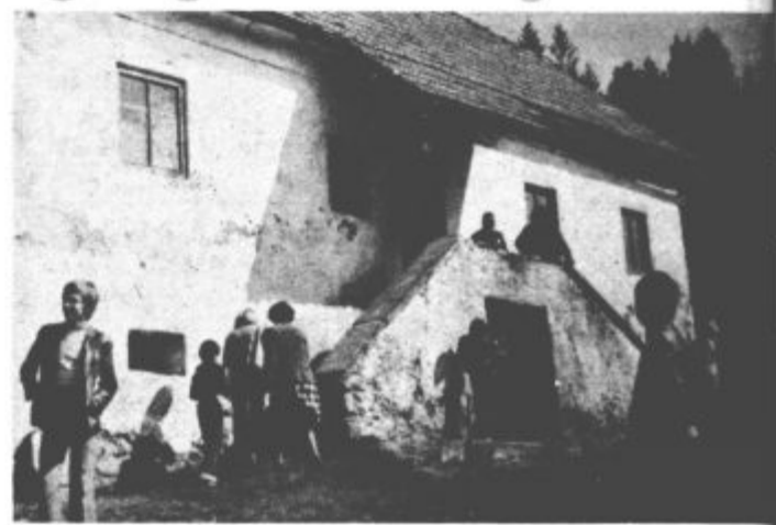
Na obisku v eni izmed partizanskih domačij.

Od 25 krožkov so najmočnejši šolsko športno društvo, v planinski krožek je vključenih kar 109 učencev, zelo močna je tudi zelena straža (77 učencev). V ustanavljanju je plesni krožek. Nanj se je že sedaj prijavilo 158 otrok. Kar 128 članov obsega prometni krožek. Zaradi velikega števila mladih risarjev smo morali razdeliti likovni krožek na dva dela. Na šoli imamo tudi številne tabornike (103), ki delujejo v taborniškem krožku. Da ne naštevamo še recitacijske-