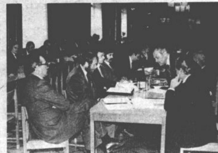
S posveta v TGO Gorenje

VREME Do konca tedna ne bo večjih sprememb. Vreme bo še suho, z meglo v nižinah.