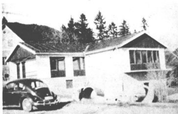
Novi prostori so vsestranska pridobitev, stare (v ozadju) bodo preuredili v stanovanja

Zagotovo so se najbolj veselili prebivalci Šmihela nad Mozirjem. Končno so namreč izročili namenu novo podružnično šolo, poleg šole v Lepi njeni zadnji