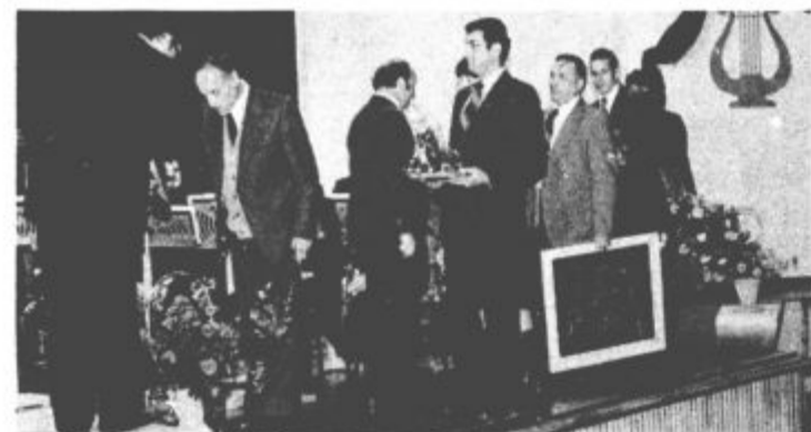
Cestitke in priznanja za jubilej.

rijo ljudje v svojem delu, most do našega dela in ustvarjalnosti. Nova knjižnica bo vsaj delno zadovoljila povpraševanje mladinski in leposlovni literaturi ter pripomogla k povečanju števila bralcev v občini. Tudi fond knjižnega gradiva, ki je v zadnjih letih dosegel razmerje ena knjiga na enega občana, bo z njo povečan. Novi knjižnici v Šmartnem ob Paki je bralcem na voljo 3150 zvezkov. Kot podružnični ustanovi matične knjižnice v Velenju, ji bo zagotovljen konstanten porast knjig ter stroškovna in usklajena nabava novega knjižnega gradiva. J. L.