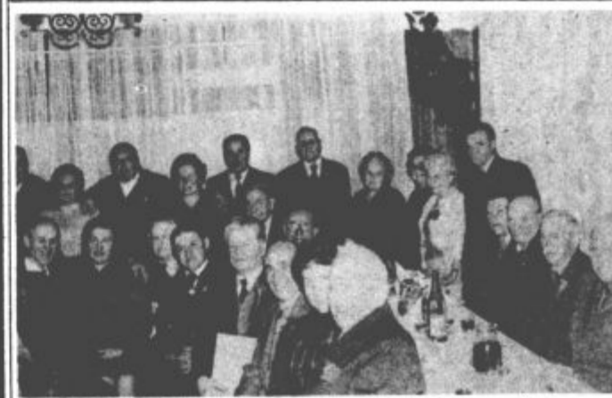
Del tistih, ki so bili presenečeni in predvsem srečni

V prazničnih dneh so se na Ljubnem prvič zbrali upokojeni obrtniki Gornje Savinjske doline - Zvrhana mera sreče in veselja in celo solze ganjenosti - Tudi 60 let v svojem poklicu