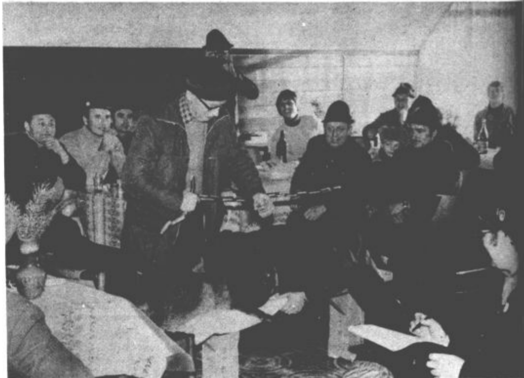
Škalski lovci priredijo vsako leto na praznik republike lov na Lubeli. Tudi za letošnji praznik ni opustili te tradicije. Ulovili so nekaj lisic ter zajcev, veliko bolj veselo pa je bilo kasneje v novem lovskem domu. Ob lovskem krstu – krstili so kar tri lovce – je bilo smeha na pretek.