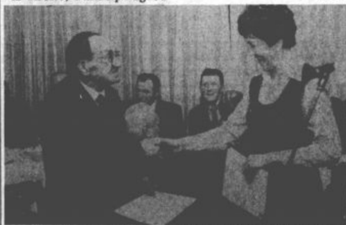
Sicer skromno priznanje, vredno pa veliko, veliko...