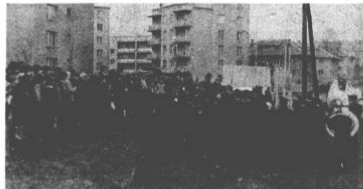
Takole so obeležili začetek pripravljanih del za gradnjo nove glasbene šole.