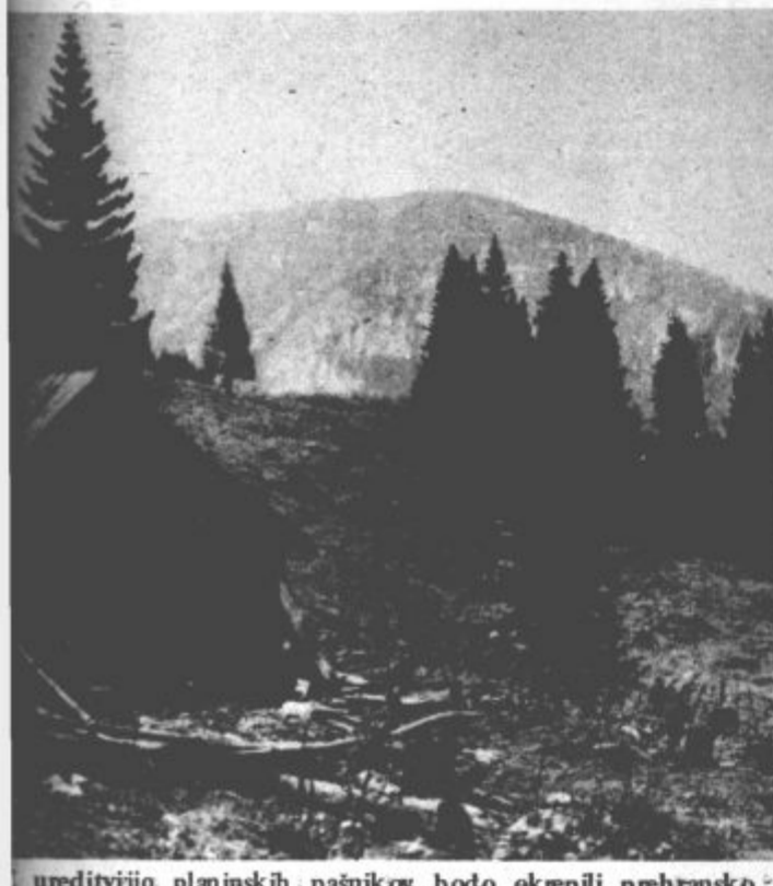
ureditvijo planinskih pašnikov bodo okrepili prehransko osnovo v živinoreji