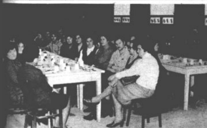
Delavci Veplasa med svečanostjo

boljša opremljenost in sodobni prostori bodo velenjskemu Veplasu že v prihodnjem letu omogočili 70 odstotno povečanje proizvodnje