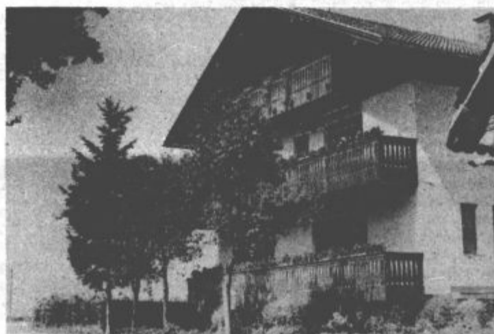
Velike možnosti razvoja kmečkega turizma

Seveda pri oblikovanju razvojnih smernic niso pozabili na krepitev produktivnejših oblik