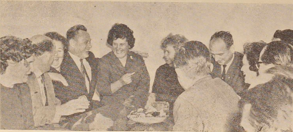
Prijetno srečanje s sindikalnimi delavci Zalske županije

Popoldan so delegacijo sindikatov sprejeli predstavniki INDIP, ki so gostom najprej razkazali potek proizvodnje, nato pa jim obrazložili sistem samoupravljanja. V prisrčnem razgovoru med člani delegacije in predstavniki samoupravnih organov je bilo največ govora o vlogi in kompetencah delavskega sveta, pa tudi o načinu dela in vlogi sindikata. Proti večeru so si gostje ogledali še tovarno metanola in osnovno šolo v Crensovcih.