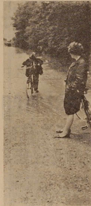
Poplave so letos tako grozeče kot že dolgo ne. Cesta med mostom na Muri in Veržejem je pod vodo. Obeta se pa še deževje in zato so prebivalci ob Muri zelo zaskrbljeni.