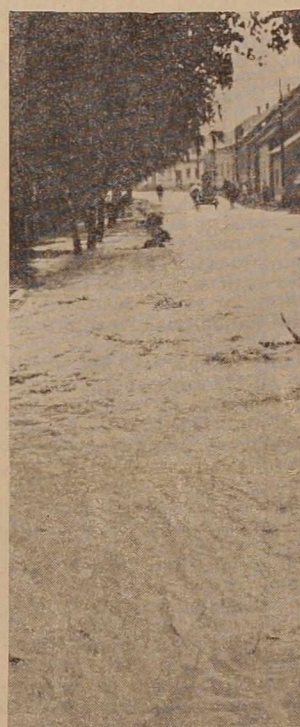
Med nalivom so se lendavske ulice spremenile v blatne potoke.

za prispevek, število kmečkih zavarovancev pa ostaja isto. Poseben problem, ki se pri tem odpira, so mali kmetje, ki imajo manj od 50 tisoč katastrskega dohodka. Kako bi se ti vključili v samofinanciranje, na kateri osnovi naj bi temeljil novi zakon o socialnem zavarovanju kmetov? Na tem posvetovanju so predlagali, da bi kmetje, ki imajo manj kot 20 arov zemlje, to se pravi do 50 tisoč katarstrskega dohodka, izločili iz kmečkega zavarovanja, kar bi v Pomurju prizadelo številne družine, za katere bi morale občinske skupščine zagotoviti zdravstveno varstvo, če bodo to zmoгле zaradi malih proračunskih sredstev. Navzoči so pripominjali, da je potrebno zobozdravstvenemu skrbstvu posvetiti večjo pozornost, predvsem kmečkim otrokom, ki doslej te ugodnosti niso imeli.