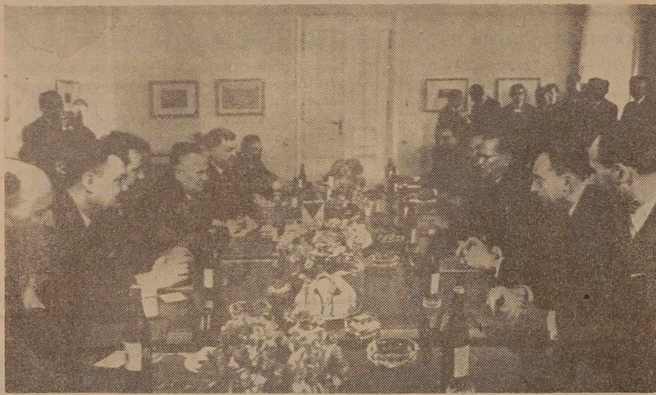
Uradni razgovori v Pragi — Na levi češkoslovaška, na desni jugoslovanska delegacija.

Sovjetski kozmonavt Leonov je dobil svojega »tekmeca« v osebi ameriškega kolega Edwarda Whitea, ki je tudi med poletom zapustil vesoljsko kabino in se malce sprehodil po vesolju, četudi z določenimi težavami.