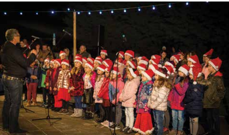
Slavnostni prižig lučk je odprl pevski zbor OŠV Ankaran. / L'accensione delle luminarie è stata aperta dal coro della scuola elementare di Ankarano.

December je čas, ko se korak upočasni, ko misli postanejo nežnejše, optimizem pa v nas zasveti kot nešteto novoletnih lučk, ki so v petek, 6. decembra, osvetlile naš kraj. Okrog osrednjega novoletnega drevesca v Ankaranu so se zbrali številni občani in prisluhnili otrokom Osnovne šole in vrtca Ankaran.