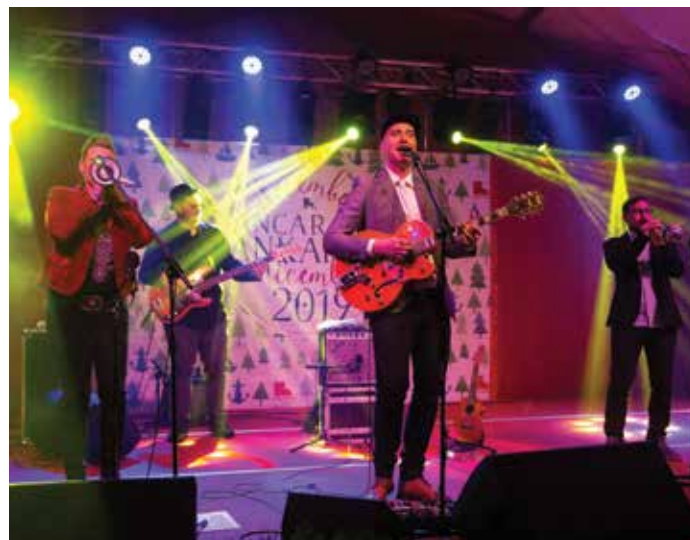
Skupina Manouche je z energičnimi in domiselnimi plesnimi ritmi dobro ogrela obiskovalce. / Il gruppo Manouche ha riscaldato il pubblico con ritmi energici e fantasiosi.

«Ogni anno dicembre ci suscita emozioni profonde, con i suoi colori e lo scintillio delle luci che attraverso i suoi simboli, ci riporta ai diversi angoli dei nostri ricordi. Sotto il manto di un'apparente leggerezza, porta alla luce molte questioni personali e sociali, poiché rafforza il senso di appartenenza e di felicità tra le persone, ma allo stesso tempo fa emergere anche la solitudine e l'alienazione. Eppure, questo è un momento in cui il mondo si illumina di una luce più piacevole, quando le parole perdono la propria cadenza aspra, quando la gioia prevale i cattivi pensieri, quando la consapevolezza per il prossimo è ancora più forte. Ad Ankarano, cerchiamo di far sì che le persone non si sentano sole e alienate» ha affermato Katja Pišot Maljevac, responsabile del Dipartimento attività sociali del comune di Ankarano.