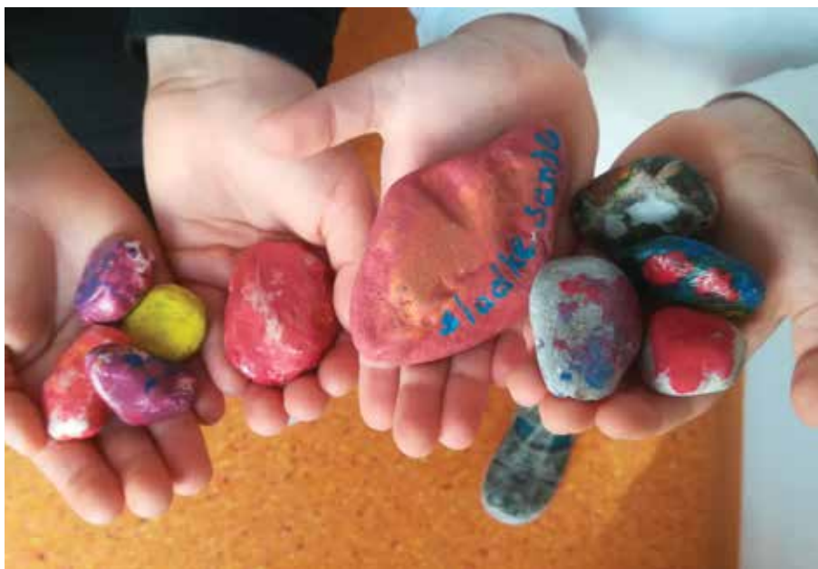
Skupaj smo v Sloveniji pobarvali in podelili več kot 15000 kamenčkov. / In Slovenia abbiamo dipinto e distribuito oltre 15.000 sassolini.

V vrtcu, kjer smo dan prijaznosti praznovali prvič, smo znova ugotovili, da se sreča z delitvijo množi – bolj kot smo bili prijazni, več prijaznosti se nam je vrnilo. V društvu KUD Pod borom pa smo znova navdušeno spremljali, kako dobro je širiti pozitivno energijo. Prijaznih dejanj smo zmožni vsi, dejanje prijaznosti pa se povezuje s človečnostjo. Henry James je o tem zapisal: »V življenju so pomembne tri stvari. Prva je, da si ljubezniv, druga, da si ljubezniv, in tretja, da si ljubezniv.« Zato kličemo prijazen dan na vse strani neba – vsak dan.