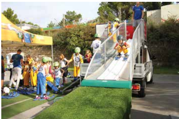
Otroci so preizkusili svoje spretnosti tudi na domiselnih športnih poligonih. / I bambini si sono cimentati su percorsi sportivi fantasiosi.

Že šesto leto zapored je Športno društvo Ankarano lokalni organizator nacionalne športno-družbene prireditve »Veter v laseh – s športom proti zasvojenosti« , ki poteka pod pokroviteljstvom Športne unije Slovenije. V sodelovanju s številnimi lokalnimi klubi, društvi in drugimi organizacijami smo 18. oktobra v kampu Adria Ankarano pripravili pestro paleto športnih in občupornih dejavnosti – zanimive športne poligone, kvize in druge aktivnosti.