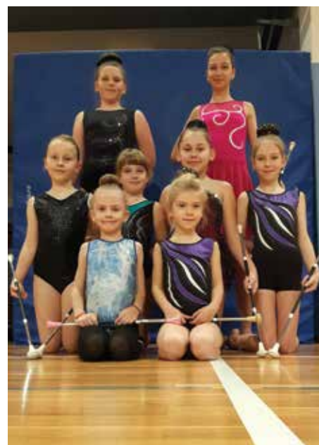
Naše športnice zelo rade nastopajo in se z veseljem udeležijo vašega dogodka. / Le nostre atlete amano esibirsi e partecipano con piacere ai vostri eventi.