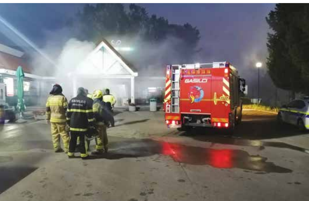
V današnjem času, ki ga zaznamujejo nešteti opravi in obveznosti, je pomen prostovoljcev vse večji. / Oggigiorno la vita frenetica e gli innumerevoli impegni aumentano l'importanza del volontariato.

La Società volontari vigili del fuoco Crevatini augura buone feste e felice anno 2020 a tutti i cittadini.