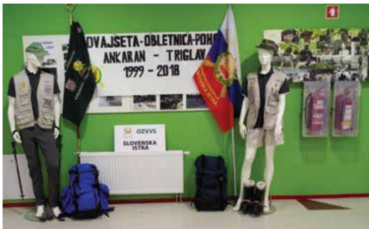
Ob odprtju razstave 12. novembra so se pohodniki srečali z učenci planinskega krožka. / Il 12 novembre in occasione dell'apertura della mostra, gli escursionisti hanno incontrato gli alunni dell'attività di alpinismo.