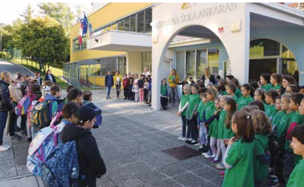
Kdor najde prijatelja, najde zaklad. / Chi trova un amico trova un tesoro.

Un proverbio italiano dice: "Chi trova un amico trova un tesoro". Sicuramente faremo di nuovo visita a questo nostro nuovo tesoro, continuando pertanto a tessere rapporti internazionali, conoscere nuovi luoghi e persone e incrementare la nostra conoscenza della lingua italiana.