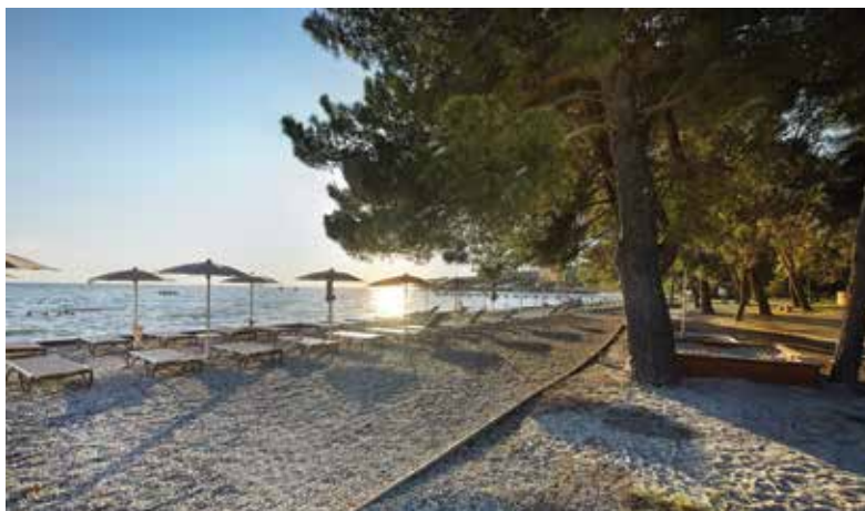
Goste in domačine je v minuli sezoni razveselila prenovljena plaža. / La spiaggia ristrutturata nella scorsa stagione, ha rallegrato ospiti e cittadini.

Dall'11 al 13 novembre, a Lubiana si sono svolte le tradizionali "Giornate del turismo sloveno", organizzate dalla Camera per l'industria alberghiera della Slovenia, L'ente turistico sloveno e molti altri importanti partner nel campo del turismo. Durante l'evento vendono assegnati i riconoscimenti per i risultati ottenuti nello sviluppo del turismo. In una forte competizione, alla società Adria è stato assegnato il riconoscimento della Camera per l'industria alberghiera della Slovenia per gli investimenti realizzati nel corrente anno, la varietà dell'offerta, l'innalzamento della qualità dei servizi e la progettazione di prodotti turistici innovativi presso il resort Adria Ankaran.