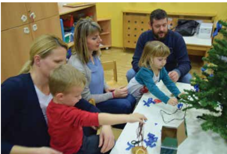
Malčkom so pomagali ustvarjati tudi starši, bratci in sestrice. / I genitori, i fratelli e le sorelle hanno aiutato i più piccoli a creare gli addobbi natalizi.

ušes so nastajale prave umetnine v obliki okraskov za novoletno jelko, okrasnih trakov, stiliziranih vej, božičnih figuric, drevesc, obročkov, papirnatih snežakov in druge zimske idile. Starejši bratje in sestre, ki že obiskujejo šolo, so s pomočjo vrtčevskih otrok poslikali vsa okna igralnic. S pobarvanimi in lepljivimi rokavi, rokavi in še čim so zadovoljni otroci ob zaključku še zarajali ob glasbi.