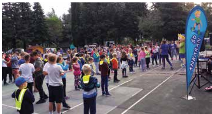
Petek smo namenili aktivnemu preživljanju prostega časa. / Il venerdì è stato dedicato al tempo libero attivo.

Vi auguriamo di avere sempre il vento in poppa! Le foto dell'evento sono disponibili sulla nostra pagina FB (Associazione sportiva Ancarano).