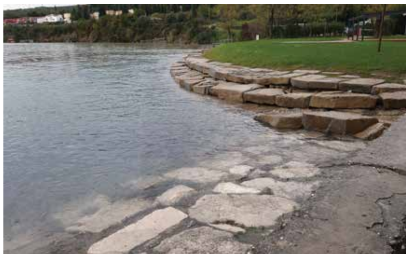
Moč morja je uničila oder Poletja v Ankaranu. / Il palcoscenico del festival Estate ad Ancarano distrutto dal maltempo.

Po prvih zbirnih ocenah je škoda na območju vseh štirih obalnih občin presežala 0,3 promila državnega proračuna. Uprava RS za zaščito in reševanje je zato izdala sklep o začetku ocenjevanja škode, ki je bilo izvedeno decembra.