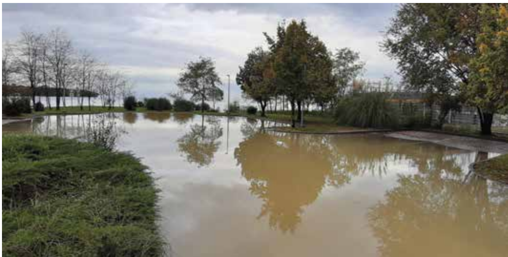
Huda ura je doletela tudi Ankaran. / Ore critiche anche per Ancarano.

Tra il 12 e il 14 novembre scorsi, la zona costiera è stata colpita dall'alta marea. Sono stati segnalati ingenti danni in tutti e quattro i comuni, mentre nella penisola di Ancarano i danni sono stati causati anche dalla forte pioggia.