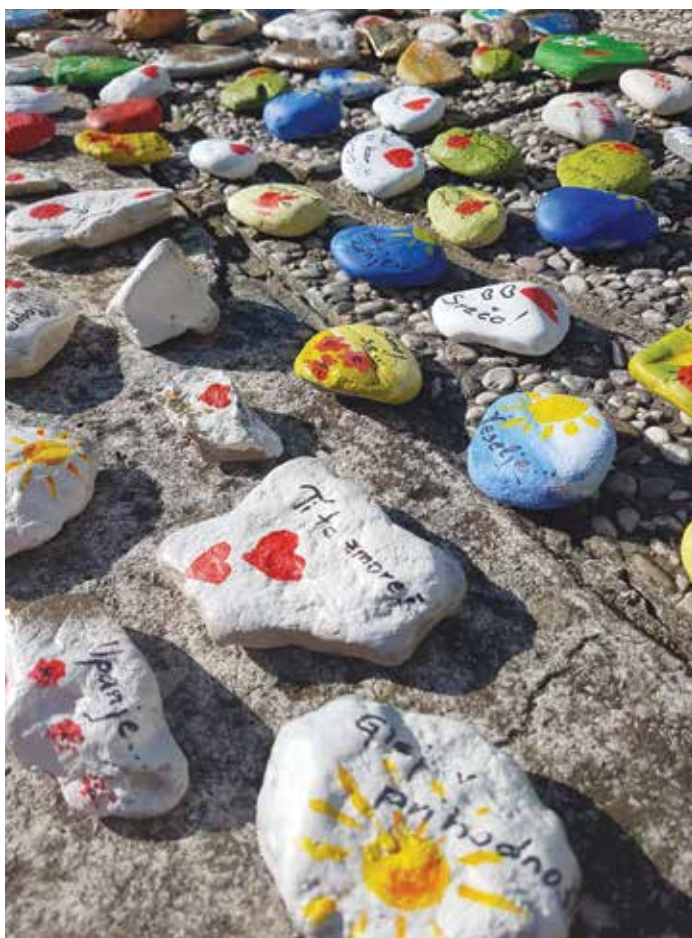
Prijaznost je človeku prirojena, a hkrati ostaja izbira vsakega od nas. / La gentilezza è nell'indole umana, ma è al contempo una scelta che ciascuno di noi decide di fare.

All'Associazione Sotto il Pino abbiamo nuovamente riscontrato con entusiasmo quanto sia bello diffondere energia positiva. Siamo tutti capaci a compiere atti gentili il che è collegato all'umanità di ciascuno di noi. Henry James scrisse a riguardo: »Nella vita umana tre cose sono importanti. La prima è essere gentili. La seconda è essere gentili. E la terza è essere gentili». Ecco il motivo nel desiderare una giornata piacevole - facciamolo ogni giorno.