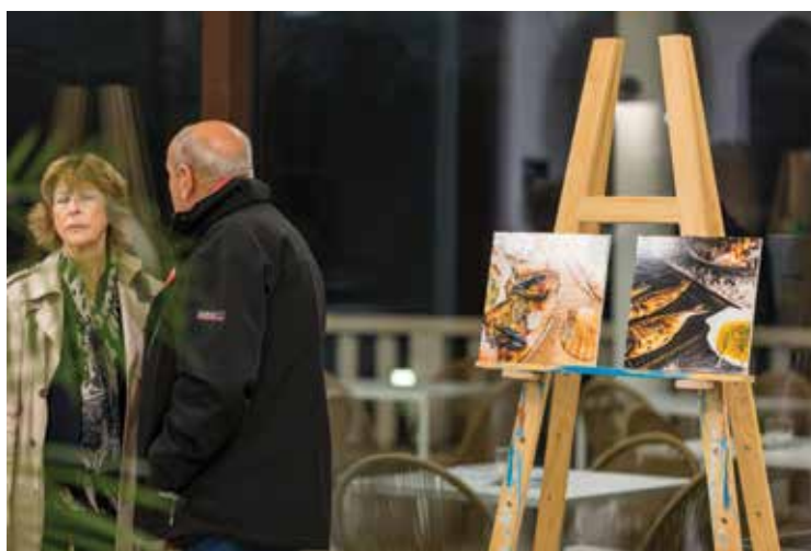
La mostra fotografica di food photo di Matija Ščukovt. / Fotografska razstava kulinaričnih dobrot Matije Ščukovta.

Zvečer so si obiskovalci ogledali fotografsko razstavo kulinaričnih dobrot mladega fotografa Matije Ščukovta in okužali jedi, pripravljene med predstavo. Predstavljeni recepti so objavljeni na spletni strani SSIN Ankaran www.can-ancarani.si .