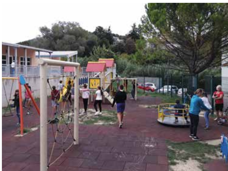
Otroci lahko zdaj aktivno preživljajo prosti čas na prenovljenem igrišču. / I bambini possono passare il tempo libero nel parco giochi appena rinnovato.

Občina Ankaran, Oddelek za razvoj in investicije / Comune di Ancarano, Dipartimento sviluppo e investimenti