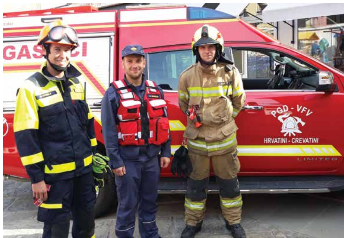
Za nas je vsak samo Človek, ki potrebuje pomoč. / Ciascuno di noi è solo una persona, che ha bisogno di aiuto.

V današnjem času, ki ga zaznamujejo hitenje in neštete obveznosti, je pomen prostovoljcev vse večji. Ni pomembno, ali gre za gasilce, prve posredovalce, bolničarje, vodnike reševalnih psov ali druge oblike prostovoljstva. Prostovoljci smo ljudje, ki z veseljem in entuziazmom delček svojega prostega časa namenjamo izobraževanju, vajam in pomoči ljudem v lokalnem okolju in širše. V vsesplošnem izgubljanju empatije do sočloveka za nas niso pomembni politična ali verska opredelitev, narodnost ali premoženjsko stanje pomoči potrebnega. Za nas je vsak samo Človek, ki potrebuje pomoč.