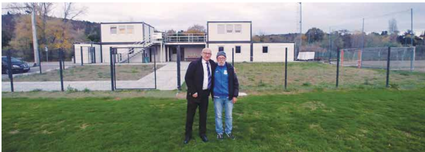
Predsednik OKS je pohvalil dosedanja prizadevanja za ureditev športne infrastrukture na Sv. Katarini. / Il presidente del COS ha elogiato gli sforzi fatti finora per la sistemazione dell'infrastruttura sportiva di Santa Caterina.