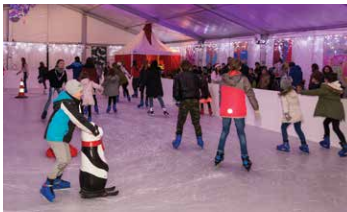
Otroci so lahko pokazali svoje spretnosti na drsališču. / I bambini hanno dimostrato le proprie abilità sulla pista di pattinaggio.

Vljudno vabljeni v našo skupno dnevno sobo pod zvezdami, kjer bo priložnosti za druženje in povezovanje veliko!