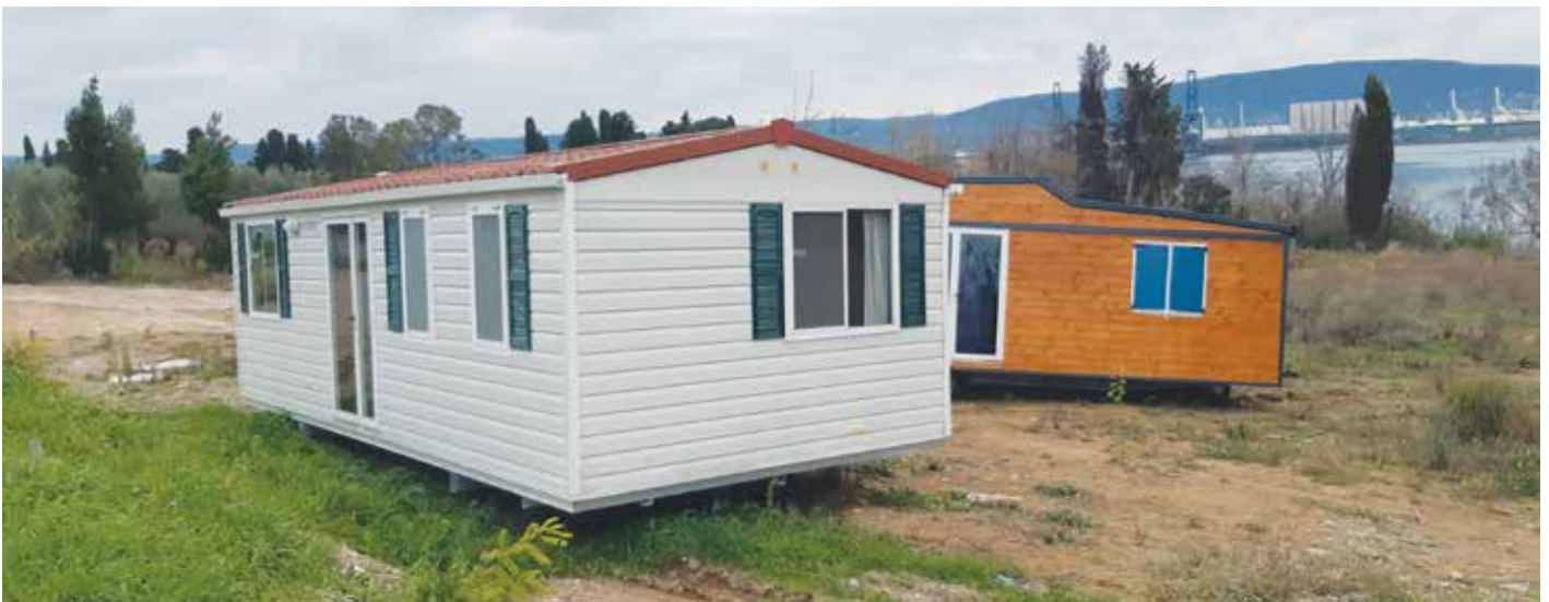
Novi nedovoljeni posegi pri Sv. Katarini. / Nuovi interventi non autorizzati nella zona di Santa Caterina.

Il comune ha più volte presentato ai cittadini e al pubblico interessato le misure di protezione del territorio, che sono attualmente in vigore, il pubblico è stato inoltre informato degli attuali divieti e restrizioni in vigore nelle zone reputate particolarmente sensibili per la pianificazione territoriale. Fino all'approvazione del Piano regolatore comunale del Comune di Ancarano, la costruzione di nuove strutture, la demolizione di quelle vecchie e la sostituzione con strutture nuove, è vietata. Nelle aree protette è inoltre vietato collocare strutture temporanee o ausiliarie e coltivare colture permanenti. Le misure di protezione attuali saranno in vigore al più tardi fino al 1° luglio 2020, per tale motivo chiediamo nuovamente che tutti i cittadini e i proprietari terrieri rispettino rigorosamente le norme in vigore.