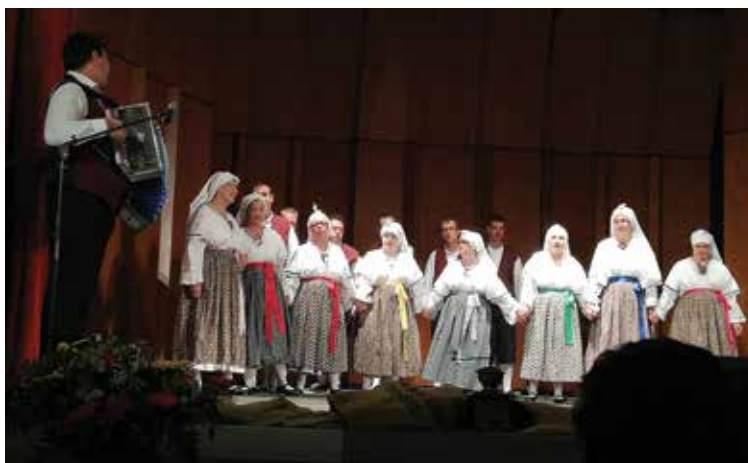
Društvo sodeluje pri številnih dogodkih v lokalni skupnosti. / L'associazione Sožitje partecipa a numerosi eventi nell'ambito della comunità.

A luglio, il comune di Ancarano ha iniziato con le attività nell'ambito del progetto Comune a misura delle persone con disabilità, che incoraggia le comunità locali a intraprendere attività pianificate e durature atte a migliorare la qualità della vita per le persone con disabilità.