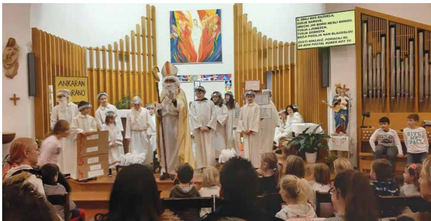
Dobra dela in grajenje odnosov so aktualni celo leto, ne samo v prazničnem času. / Le buone azioni e i buoni rapporti vanno mantenuti durante tutto l'anno e non solo durante le festività.

Buon Natale e ogni bene nell'anno nuovo!