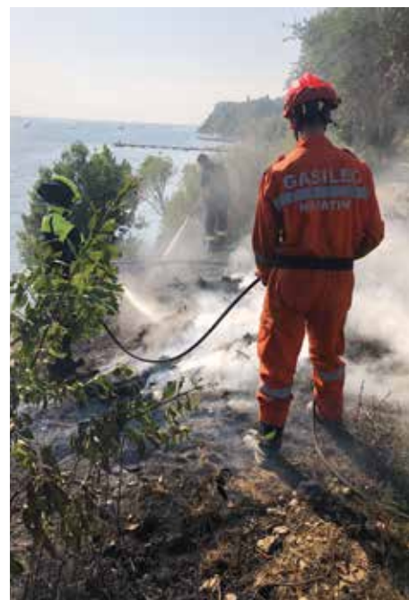
Poziv »NA POMOČ« pride kadarkoli – 24 ur na dan, 365 dni v letu. / La richiesta di "AIUTO" può pervenire in qualsiasi momento - 24 ore al giorno, 365 giorni all'anno.

La vita quotidiana di un vigile del fuoco volontario comprende turni di guardia, esercitazioni e addestramenti che però sono pianificati in anticipo, in modo da facilitare il concilio con le attività personali. Tuttavia, gli incendi, i venti forti o altre situazioni che richiedono l'attività del vigile del fuoco, non si possono prevedere. Il vigile del fuoco volontario è pertanto all'erta 24 ore al giorno, 365 giorni all'anno. In questi casi, i vigili operativi sono dovuti a recarsi il prima possibile alla caserma e munirsi dell'attrezzatura necessaria per l'intervento. Sfortunatamente, quando qualcuno ha bisogno di aiuto, non importa se stiamo pranzando, giocando con i nostri figli, abbracciando i nostri cari o riposando di notte.