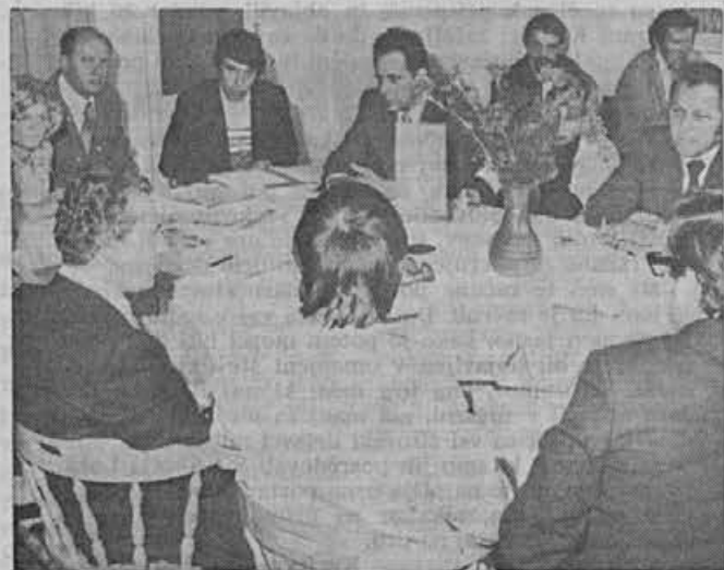
Delovni sestanek o informiranju v Alpini

»Mala ustava« — Zakon o združenem delu, ki je v razpravi — uresničevanje in krepitev delavskega samoupravljanja