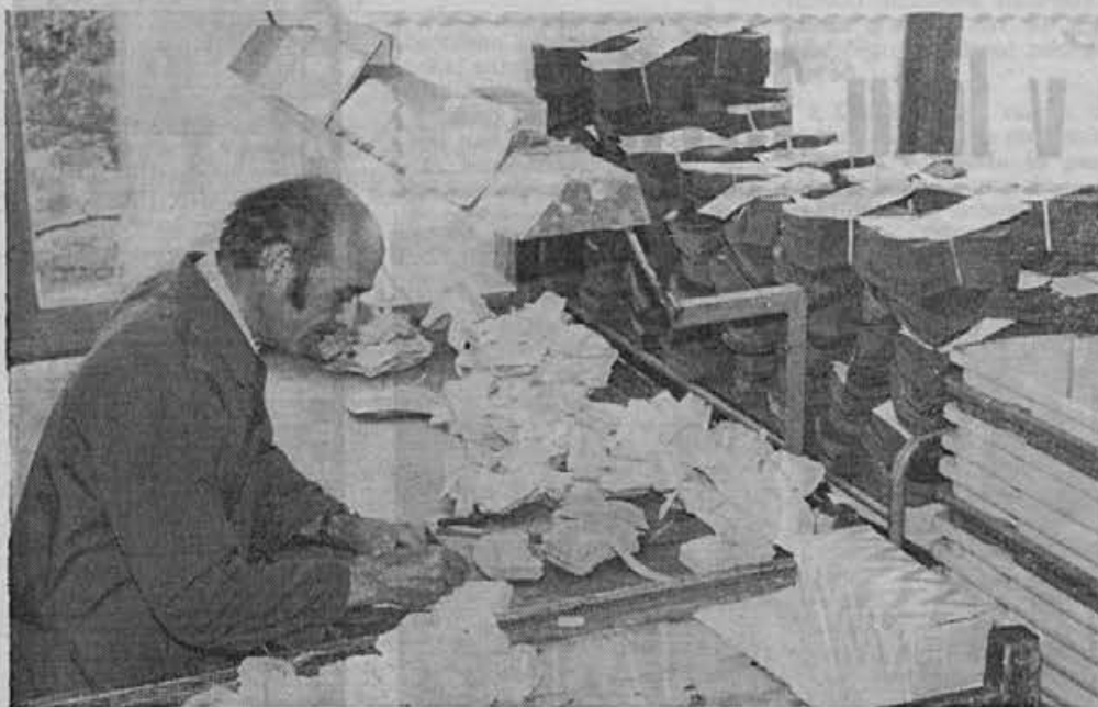
Kontrola nasekanih sestavnih delov