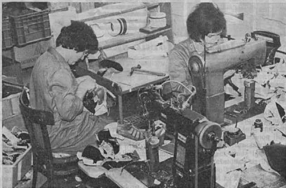
Popravilo defektov zahteva natančnost

Dejstvo je, da so problemi bili in verjetno bodo. Toda naloga nas vseh mora biti, da bo le-teh čim manj. Ne smemo pa dovoliti problemov zaradi slabe priprave