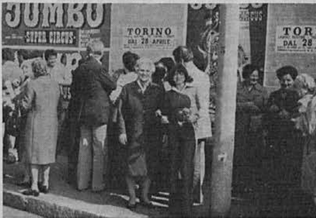
Ideja ne pozna meja

Brezštevilna množica je ob glasnem vzklikanju »prišel je naš čas«, pokazala svojo moč in ogromen politični uspeh, ki so ga italijanski komunisti v tem boju dosegli.