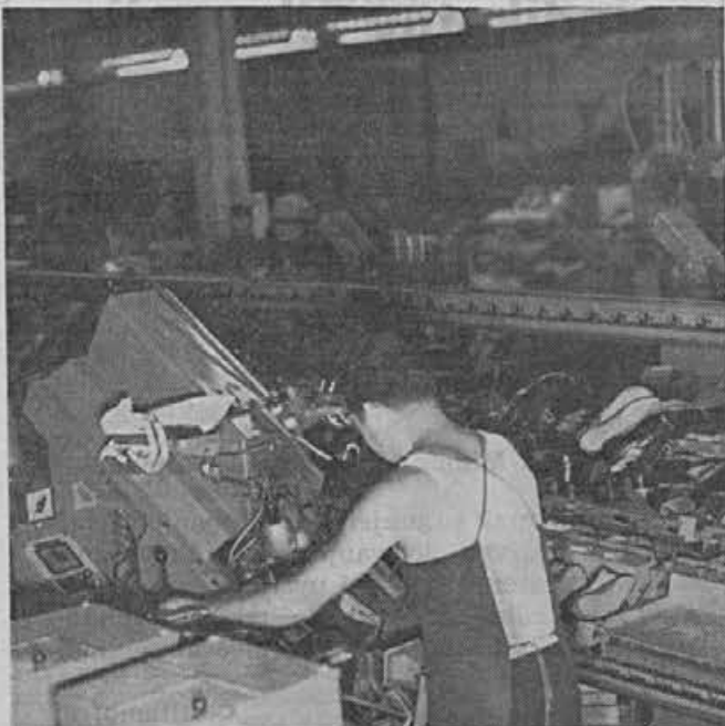
Prva ključna operacija v montaži

VPIS POSOJILA ZA IZGRADNJO IN REKONSTRUKCIJO CEST V SRS — NANA BODOČNOST