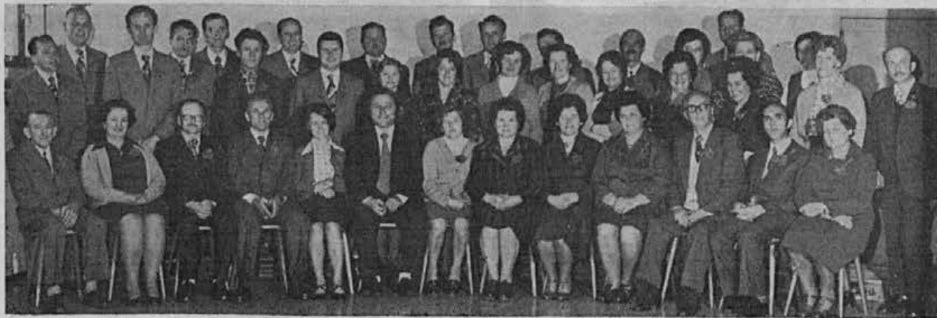
Seznam jubilarantov in spomlni na strani 5