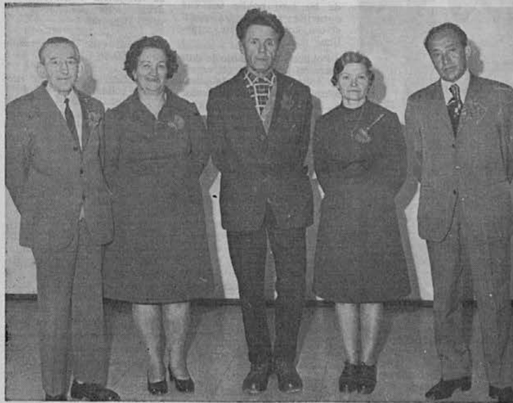
Trideset let združujejo svoje delo v Alpini