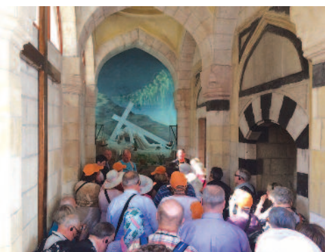
Med križevim potom, Via Dolorosa, Jeruzalem