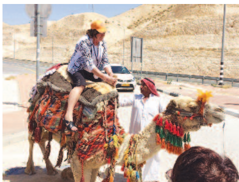
Nekateri so bili tudi na kameli