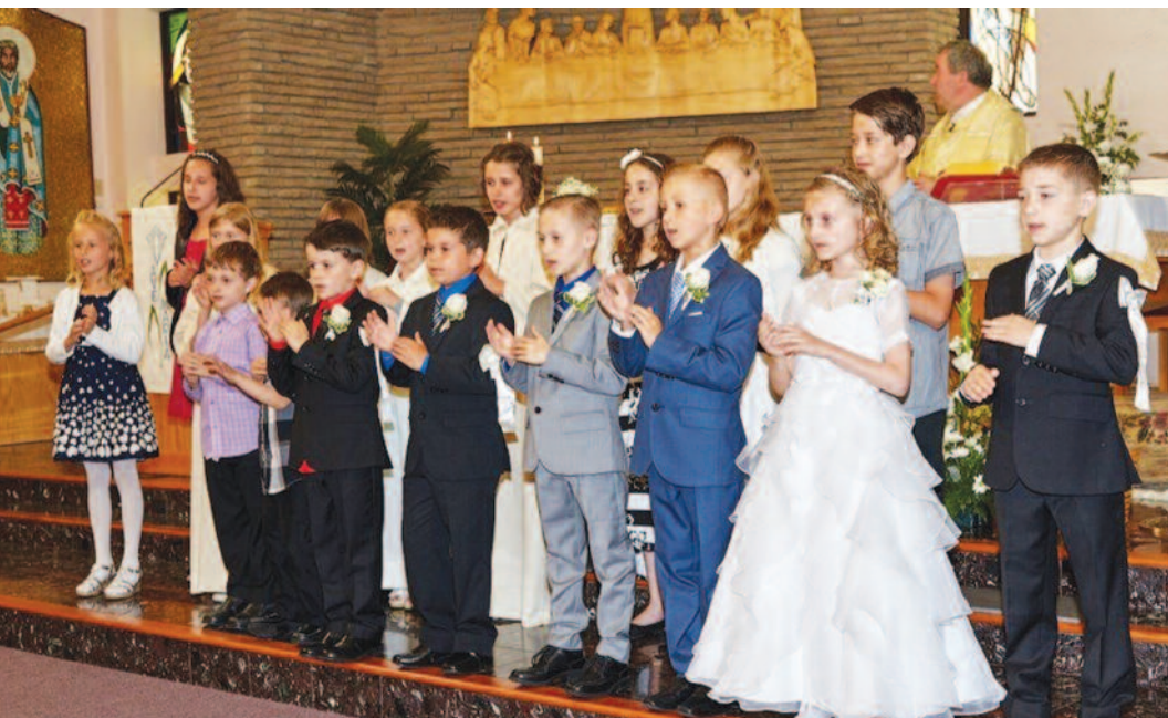
Prvoobhajanci in drugi otroci pred oltarjem