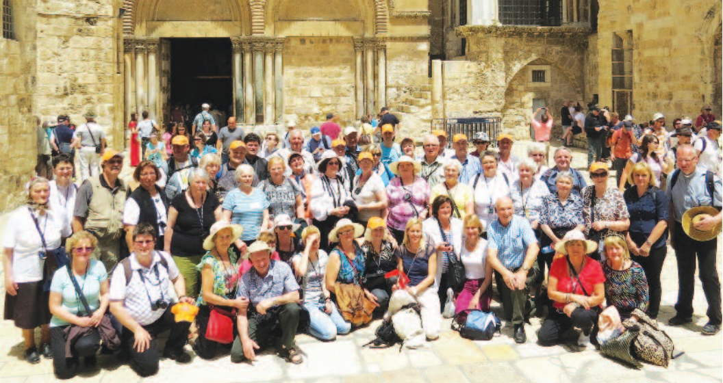
Skupinska slika pred cerkvijo Božjega groba, v Jeruzalemu