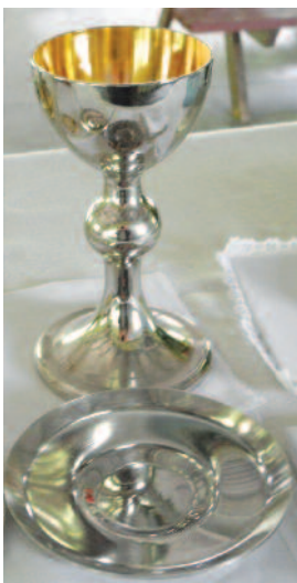
Novi kelih in patena

Slovenska skupnost je pred 50. leti kupila zemljišče za letovišče. Na telovo se je začelo jubilejno leto letovišča. Župljan Franc Rajbar je letovišču podaril kelih in pateno, ki ju je sam izdelal. Ta prelepi dar je