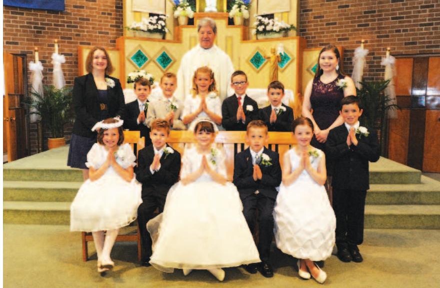
Prvoobhajanci z župnikom in katehistinjama

sveti maši je bilo v dvorani kosilo za tiste družine, ki so se za kosilo prijavile. V bodoče bo na predlog škofa sv. birma že v sedmem razredu in ne v osmem kot do sedaj.