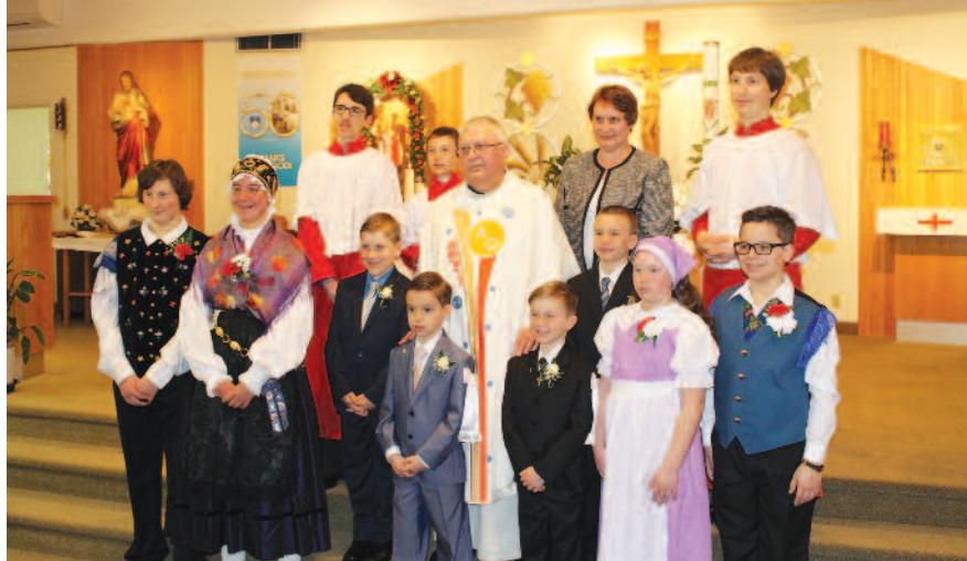
Ob praznovanju prvega svetega obhajila v Montrealu

da se iz leta v leto počasi manjša število udeležencev.