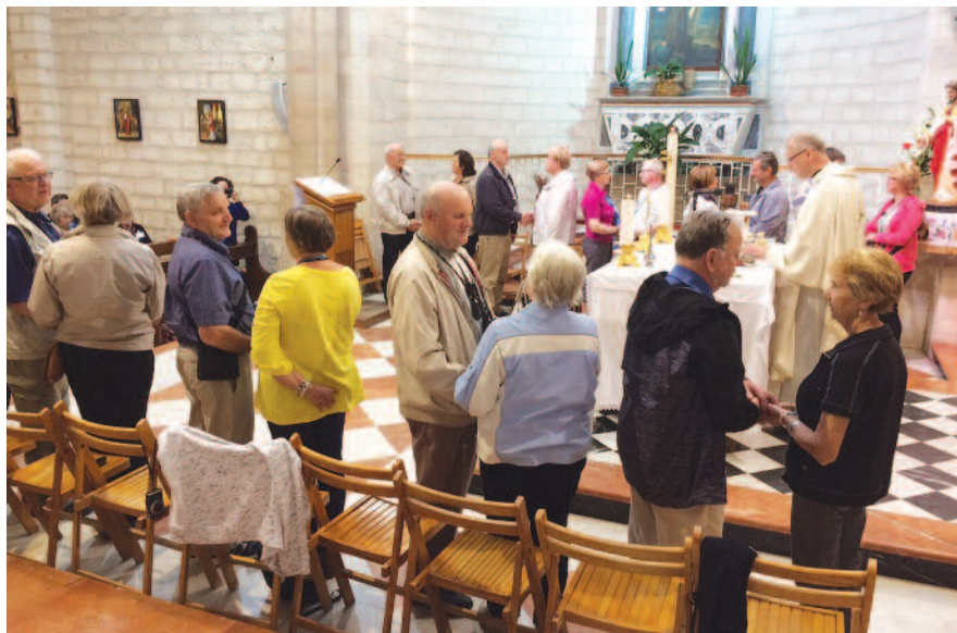
Obnovitev zakonskih obljub med sv. mašo v Kani Galilejski