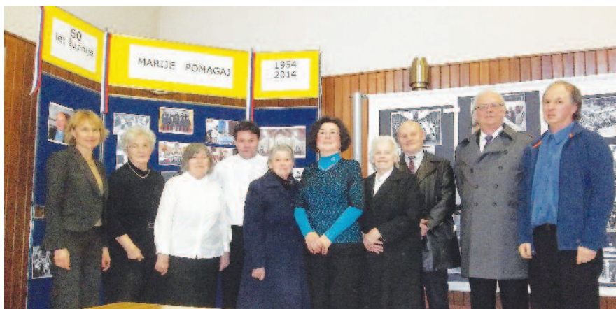
Nekateri člani Pastoralnega sveta in Misijonskega krožka Marije Pomagaj

Za njihovo delo in prizadevanje smo jim zelo hvaležni. Več pozornosti pa bilo treba posvetiti vzporejanju raznih nabirk in prireditev, da bojo župljani lažje sodelovali in pripomogli k še boljšemu uspehu. Neprijemno je, da v teku Sharelife organiziramo še kako drugo nabiralno akcijo, če to lahko storimo ob bolj primernem času, prej ali pozneje. Kljub vsemu je bilo za praznike dovolj butaric, peciva in potic in nobenemu ni bilo treba iti domov s praznim želodcem.