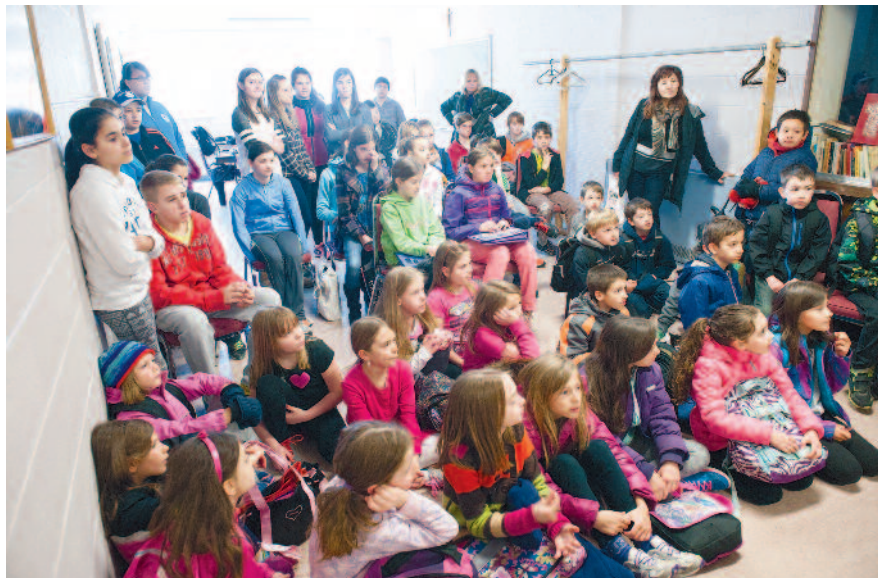
V Slovenski šoli pri Brezmadežni se dogaja marsikaj zanimivega

Poleg rednega pouka smo se učitelji udeležili dvodnevnega semi-