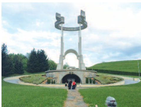
Pri spominskem parku, Teharje