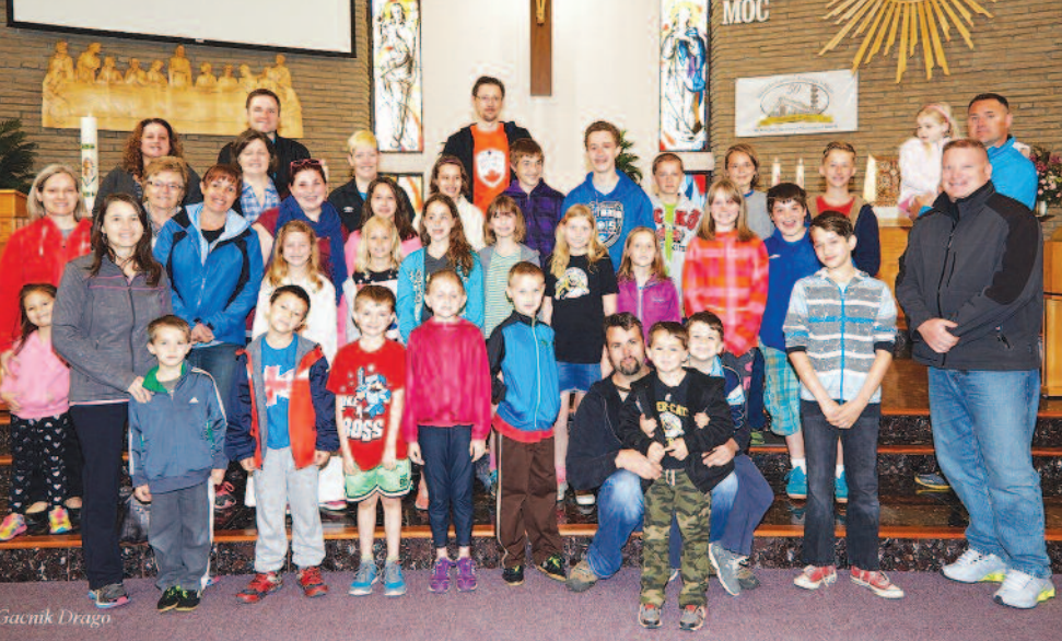
Otroci in starši po sv. maši, ob zaključku Slovenske šole v Hamiltonu

angleški zbor. Iskrena zahvala gre vsem, ki so ob praznikih sodelovali in pomagali.