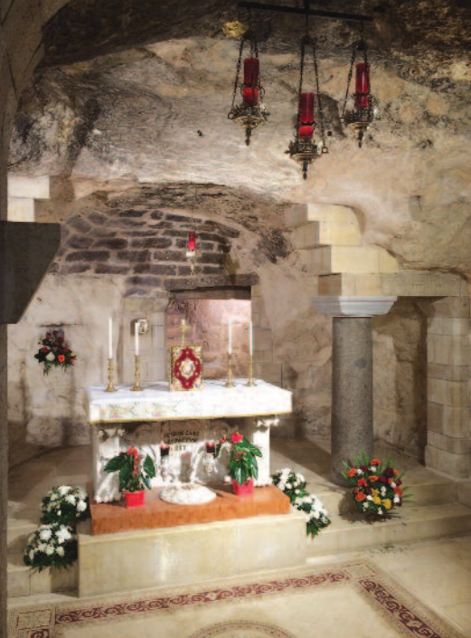
Marijina hiša pod cerkvijo, Nazaret

Petrom poromali v samostan Klaris, kjer smo se nekaj časa zadržali v skupni molitvi s sestrami in se nato z dvema od njih pogovorili. Pot nas je vodila naprej k ogledu čevljarškega in kupinarskega muzeja. V Ižakovcih, na Otoku ljubezni, smo si ogledali še broderski muzej in mlin na Muri ter se z brodom peljali čez Muro, na Štajersko stran. Dan smo sklenili pri Jeruzalemski Materi Božji, ki kraljuje med samimi goricami (vinogradi) v osrčju Prlekije, v Jeruzalemu.