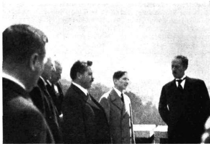
Nj. Vel. kralj Peter na grajskem stolpu v Ljubljani

oddelka za civilno letalstvo pri komandi vojnega letalstva je objavila dne 25. julija obširno uradno poročilo o vzroku nesreče, ki je bil zgolj megla ter usodni obrat z letalom na levo.