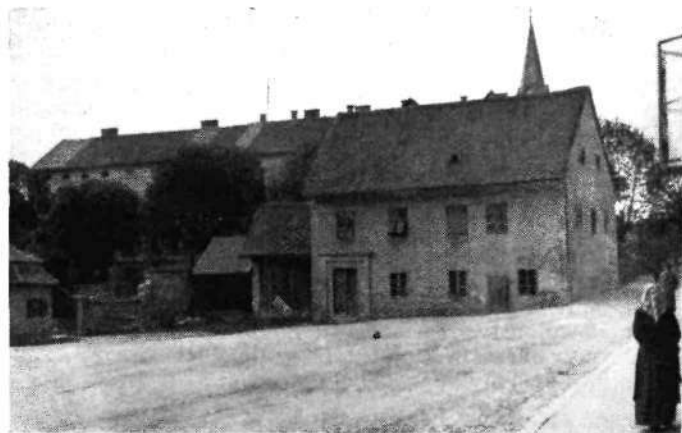
Stara stavba na vogalu Slovenske in Strossmayerjeve ulice od vzhoda