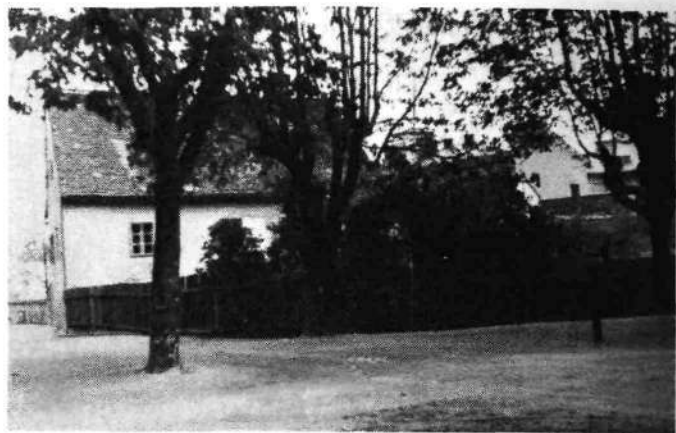
Stara stavba na vogalu Slovenske in Strossmayerjeve ulice od zahoda