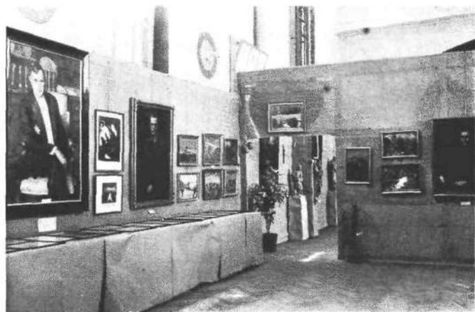
Del B. Jakčeve in Vavpotičeve razstave v Novem mestu.