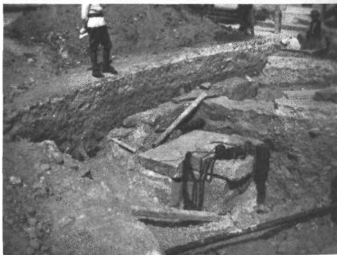
Rimska grobova pod cestiščem Groharjeve ulice v Ljubljani