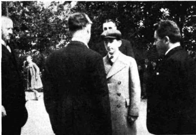
Ljubljanski župan pozdravlja Nj. Vel. kralja ob prihodu na Grad