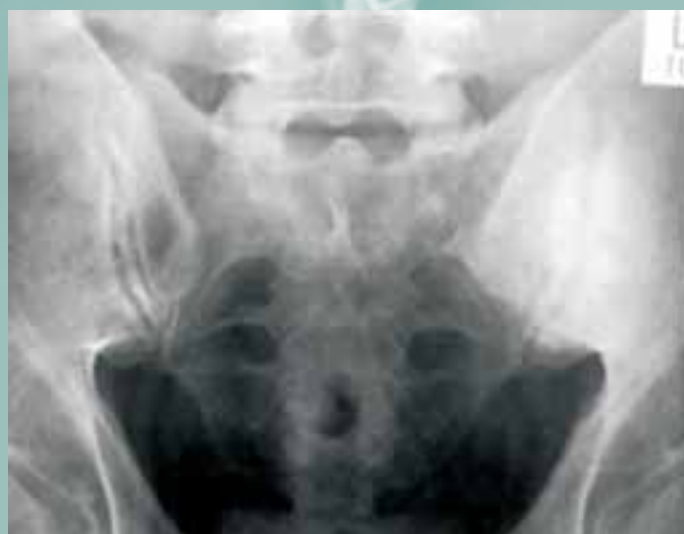
Slika 6: Sakroiliitis levo

Napotna diagnoza pri pacientih, ki so bili poslani na preiskavo je bila v večini primerov sum na sakroiliitis pri