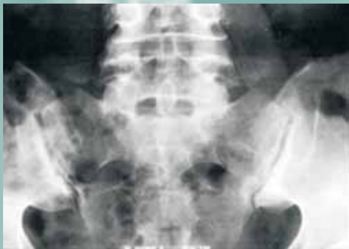
Slika 5: Sakroiliitis obojestransko

Testni predel v rtg diagnostike PsA so roke, stopala, SIS in hrbtenica. Mali sklepi rok in nog so pri tej bolezni