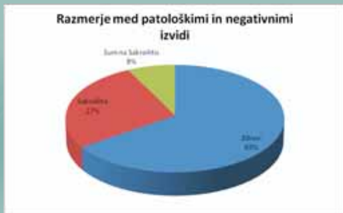
Graf 1: Razmerje med patološkimi in negativnimi izvidi