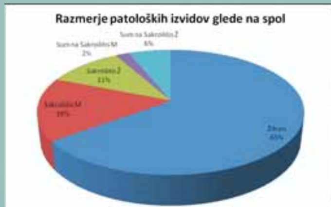
Graf 2: Razmerje med patološkimi in negativnimi izvidi glede na spol

sumu na seronegativni spondiloarthritis. V desetih primerih je bila napotna diagnoza bolečine ledveno, pri treh pa degenerativne spremembe.