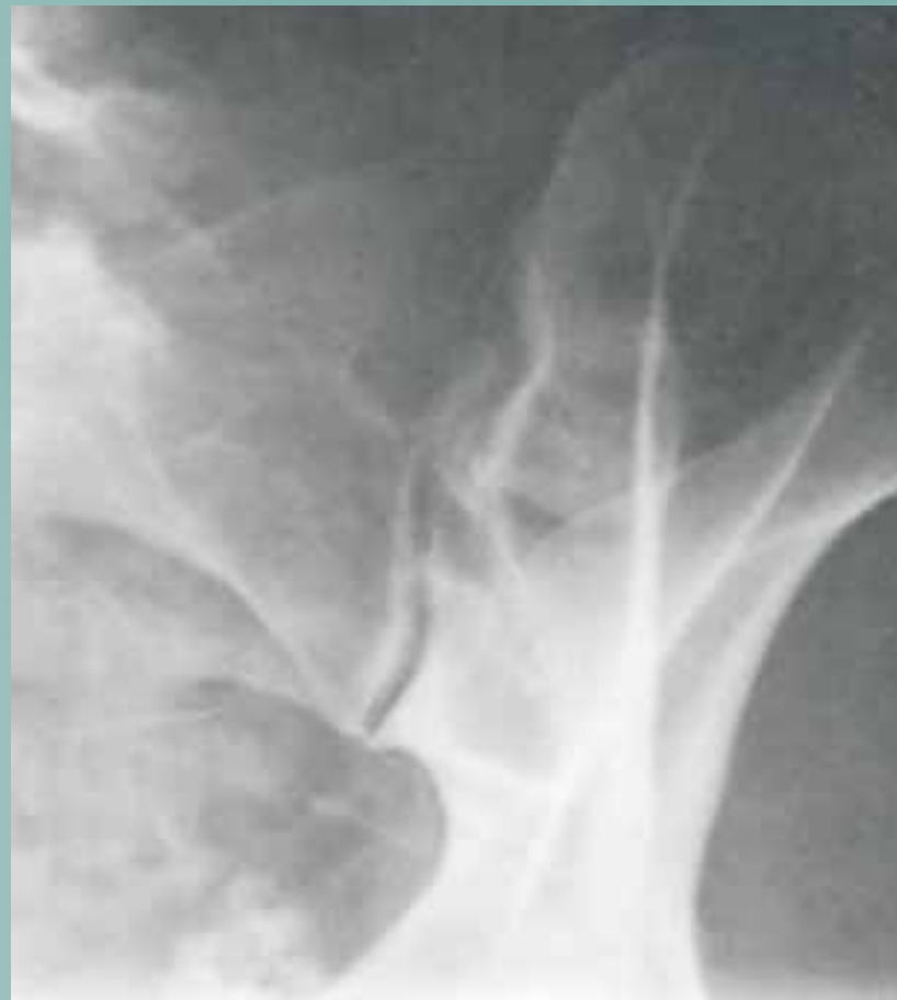
Slika 4: Rentgenogram SIS, polstranska projekcija