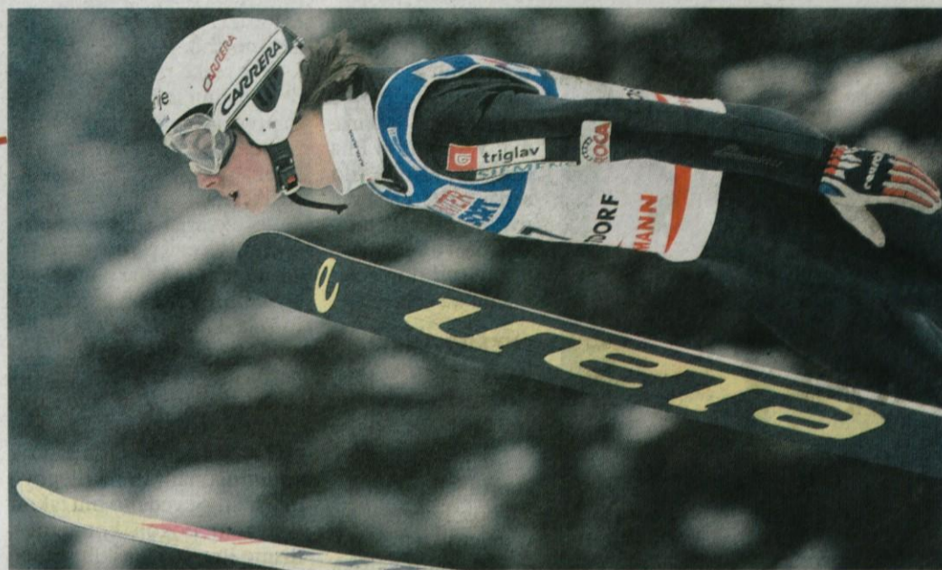
Zmagoviti skok svetovnega prvaka Roka Benkoviča.

Sponzorske obveznosti so precej rigidne. Vseeno so v