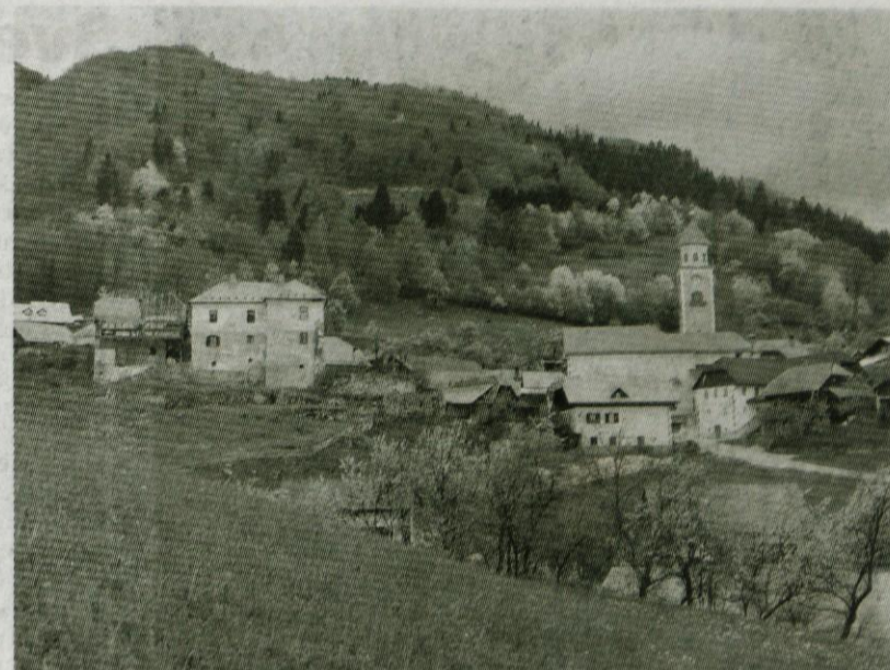
POGLED NA ZGORNJI TUHINJ - l. 2003 ob podiranju gospodarskega poslopja.

Žal se pisni viri o tem, da je bilo staro župnišče nekdanji lovski dvorec Celjskih grofov in da naj bi prvotno gotsko cerkev iz 13. stoletja prav tako zgradili Celjski grofje, še niso našli. Cerkev se prvič omenja šele v vizitacijskem zapisniku dragocenosti iz leta 1526. O tem obstaja le ustno izročilo in zapisi v krajevnih leksikonih. Vas je bila izpričana že leta 1213, cerkev je bila večkrat prezidana, vendar so pri obnovi leta 1967 našli zazidan zgodnjegotski portal, gotška okna, ostanke fresk in druge gotške elemente. severni steni prezbiterija je vzdignjena kamnita plošča s ščitom, ki ima relief dvočlanskega orla s krono, napisom in letnico 1534 (ki je bil prvotno na starem župnišču), kar priča o pomembnih lastnikih. Cerkev je bila sprva podružnica kamniške parohije. Iz nje se je izločila pred letom 1526 kot vikariat, s stalnim