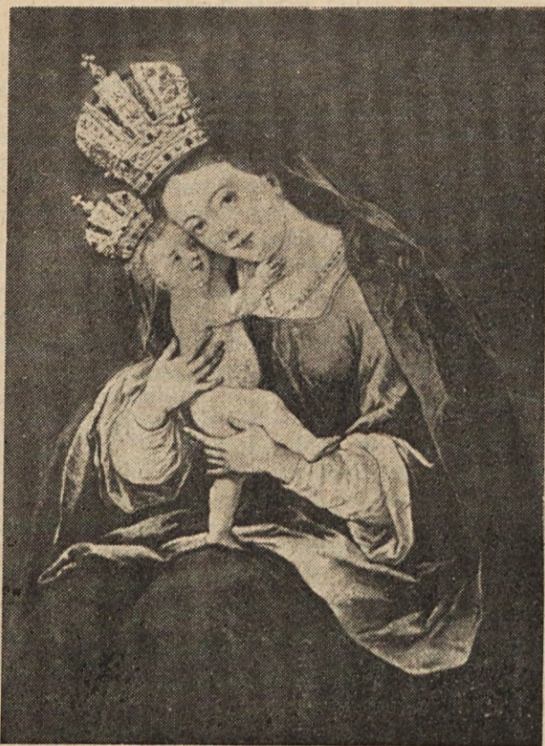
¡Que sorpresa al encontrar la imagen de la Virgen de Brezje en las chacras de Cinco Saltos!

Čas je hitel, zato smo morali tudi mi. Kar vsi smo stopili na auto in zbrzeli proti Rennerju, ki je bil pa sam za gospodarja in gospodinjo. Žena je odšla s hčerko k zdravniku. Škoda, da nismo prišli vsaj pol ure prej!