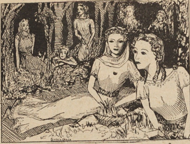
Sobre el césped cubierto de margaritas . . .

que se movía ligera, bajo los ágiles dedos de los marinos griegos, enfilando su proa hacia el Mar de Mármara; pasaron bajo el Cuerno de Oro. Pronto desaparecieron las poderosas construcciones reemplazadas por casas bajas; donde no había desembarcadero se veía alguna que otra cabaña de pescadores. Una fresca brisa soplaba de Tracia; murmuraban los enhiestos pinos; los blancos almendros perfumaban; por las rocas trepaba la hiedra; las hojas acorazonadas se movían alegremente. La nave se dirigió hasta la mitad del camino a "Arizokerato", al lado de la muralla de Teodosio y desapareció; llegaron al campo de Marte, en las afueras de la ciudad, donde estaban reunidas las grandes tropas y los ejércitos palatinos. Oyeron el entrec chocar de las armas, los huecos golpes sobre los escudos, el vibrar de las cuerdas de los arcos y el silbar de las flechas.