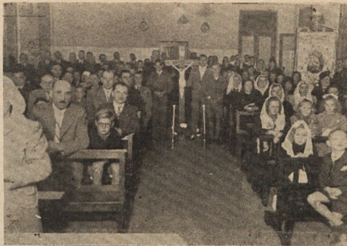
Los Católicos yugoeslavos, con el motivo de su séptimo aniversario, reunidos en la capilla de Avellaneda.

Popoldne se je spet zbrala številna družina. Vsi rojaki, ki se skozi sedem let že zbirajo, so prihiteli. Med prelepim petjem smo molili rožni venec in litanije, nakar je sledil nagovor, v katerem je g. Hladnik izrazil svojo hvaležnost do prekmurskih rojakov, ki so vsak čas dokazali svojo resnično vero ne le s tem, da so pridno k službi božji prihajali, temveč tudi v tem, da so kot pravi učenci Jezusovi vedno tudi dokazovali v življenju svojo vero s premnogimi žrtvami za lepoto službe božje in z medsebojno bratsko ljubeznijo. Posebno pevci so imeli premnogokrat težavne naloge pred seboj, pa so se vselej tako lepo izkazali. Društvo "Slovenska Krajina" je en viden sad tega lepega dela na Avellanedi. Brezjanska zastava je drugi dokaz globoke in iskrene vere; križ blagoslovljen ob sedmi obletnici pa je priča, da se nikdar nočejo sramovati