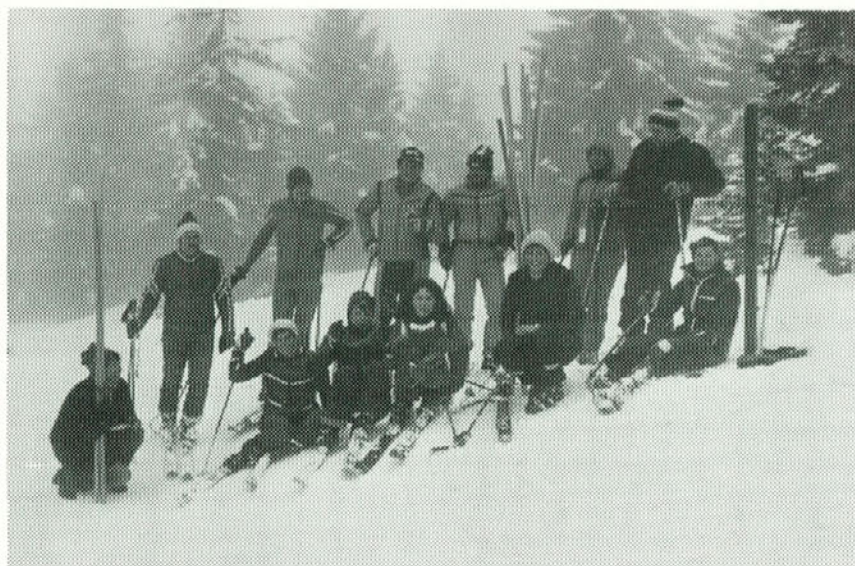
Naši smučarji na tekmovanju