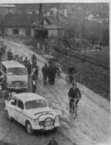
Na sliki vidimo kolono vozil propagandne vožnje, ki je šla pred dnevi v Žalcu

Komisija za varnost prometa pri občinskem ljudskem odboru Žalec je v sodelovanju z avto-moto društvom »Hmeljar« in združenjem soferjev v Žalcu organizirala propagandno vožnjo z motornimi vozili. Namen vožnje je bil, da opozore uporabnike ceste na red in disciplino v prometu in na spoštovanje prometnih znakov. Naslov akcije je bil »Prometni znaki — činitelji varnega prometa«. V koloni se je zvrstilo nad trideset osebnih avtomobilov in večje število motoristov. Za usmerjanje vozil in varnost na križiščih pa so skrbeli pionirji — miličniki. Bili so v unifor-