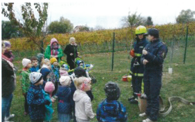
Otroci so si ogledali opremo gasilcev in izvedeli marsikaj o požarni varnosti.

Naša jesen v vrtcu je bila obarvana zelo zanimivo in pisano. Nekaj utrinkov smo zabeležili tudi na fotografijah: