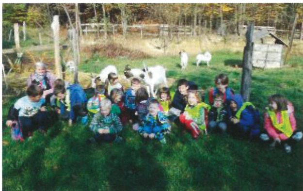
Tudi Mali pohodniki so bili pridni.