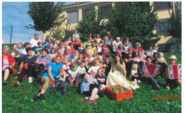
Pobirali so grozdje v vinogradu.

Sedaj ste se lahko prepričali, da je prav res, kar smo napisali v naslovu: V VRTCU KOG NAM JE LEPO. Prepričani smo, da bo tako tudi v novem letu 2019.