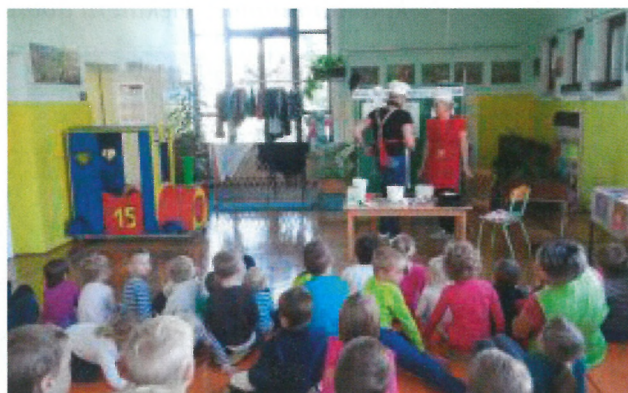
Zabavali so se ob predstavi o peki palačink. Nekaj pa so jih seveda tudi pojedli. Njam, kako so bile dobre...