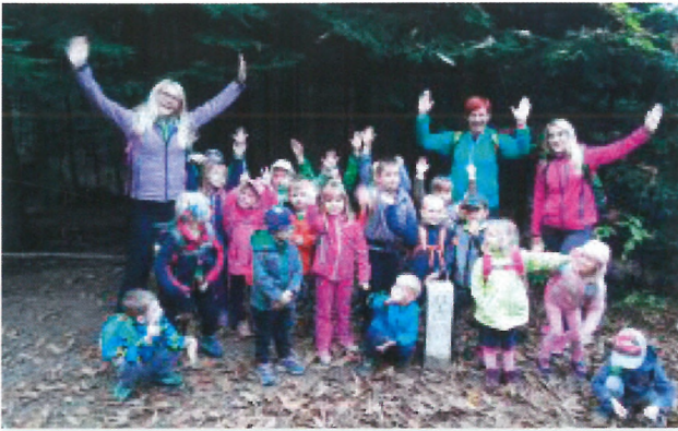
Šli so v vrtec v naravi s prijatelji iz Miklavža. (Sv. Duh na Ostrem Vrhu).