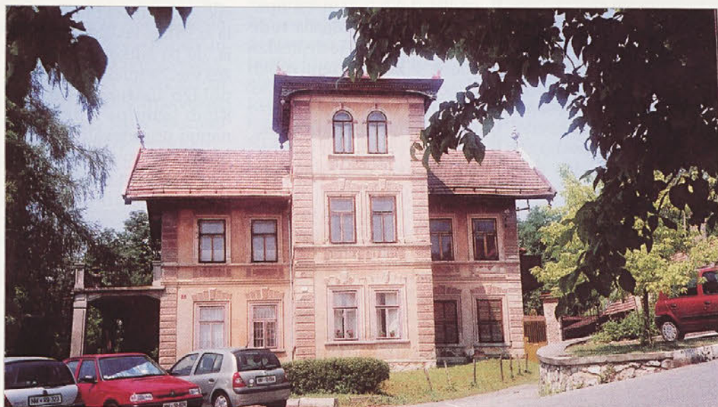
Paučičeva vila s posebnim videzom in krasnim vrtom je nedvomno ena izjemnih novomeških hiš