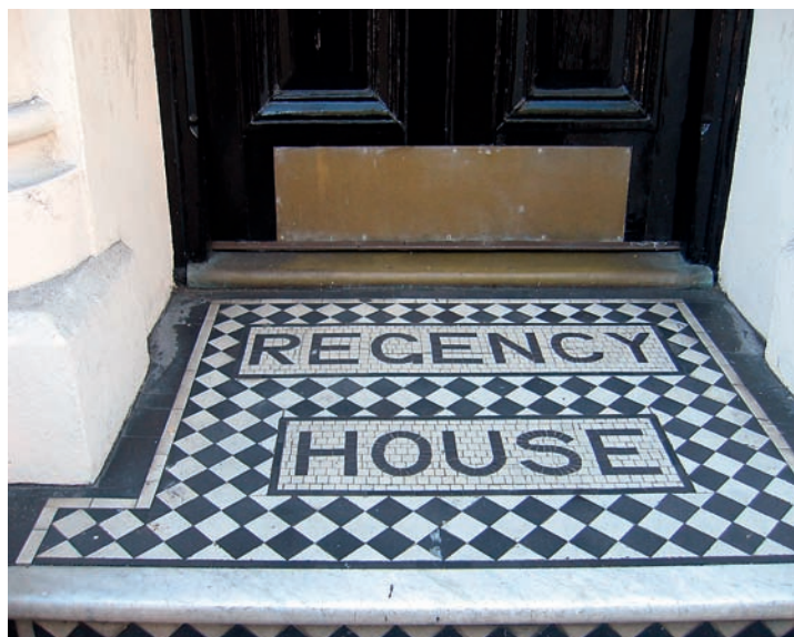
Tlakovanje z linernim napisom s konca 19. stoletja pred vhodom v brightonsko domovanje.

OpenType < http://www.adobe.com > 26. 9. 2007