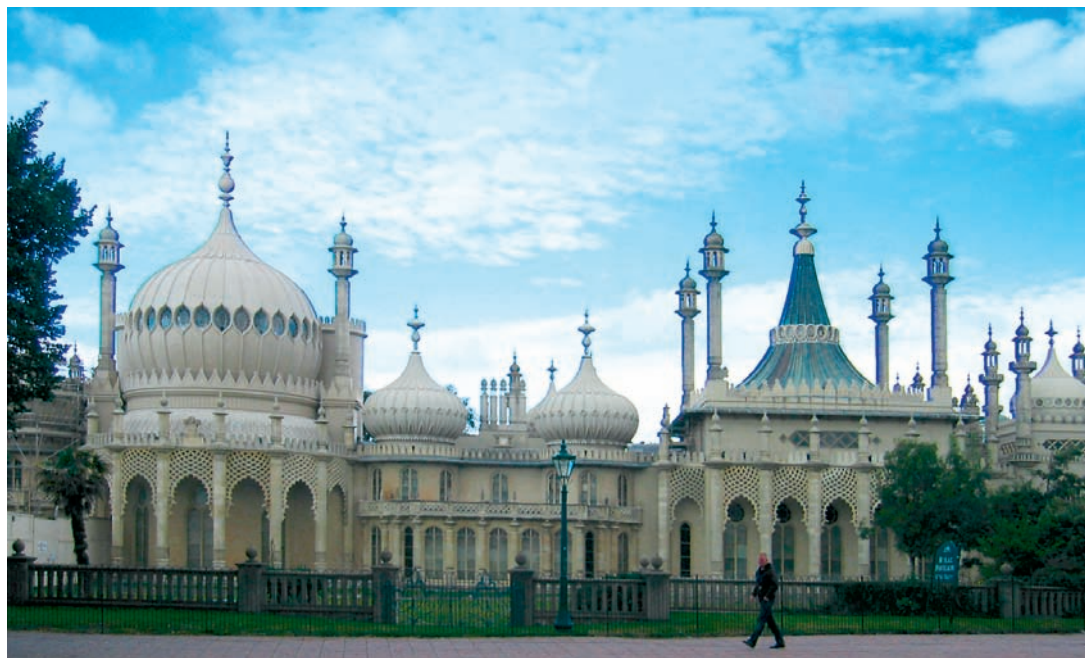
Nasproti fakultete za umetnost in arhitekturo stoji največja znamenitost Brightona – kraljevi paviljon ( The Royal Pavilion ).