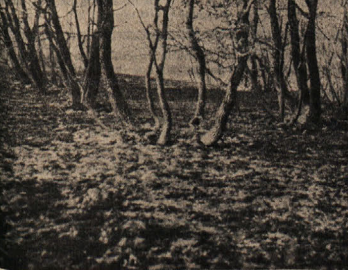
Pogorišje na Volniku

Šele včeraj popoldne ob 18. uri nekaj nad 20 gasilcev iz Trsta in iz Opčin, 150 gojenecv šole javne varnosti ter nad sto vojakov po dveh dneh hudih naporov dokončno pogasilo požar, ki je v soboto proti večeru izbruhnil pri železniški postaji pri Krepiljah, pod Prelovcem in se kmalu nato razširil čez mejo, vse tja do Repniča.