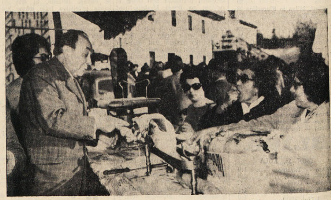
Vsakoletni prizor v Ricmanjih. Kako gre v slast prhut, ki ga potem zalije z dobro kapljico

V nedeljo, na praznik sv. Jožefa, smo imeli zares lep, pomladanski dan, kot nalašč za izlete v naravo. Po Krasu in v Bregu je bilo vse polno izletnikov iz mesta, povsod so parkirali avtomobile in se navdušeno svežega zraka. Vse polno gostov pa je seveda