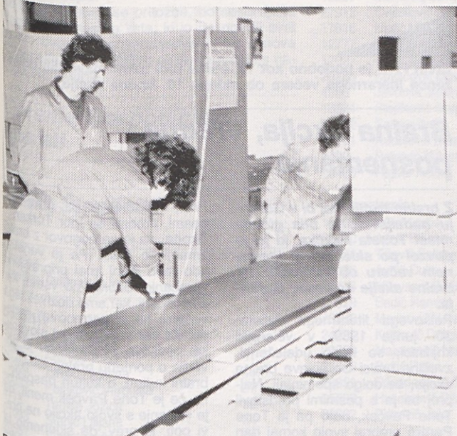
Preden delovne plošče razrežejo, jih temeljito pregledajo, saj kupci zahtevajo brezhibne izdelke