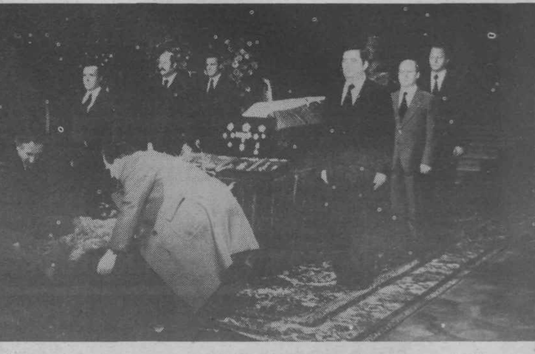
Častna straža naših občanov ob pokojnikovi krsti v veliki dvorani izvršnega sveta SR Slovenije