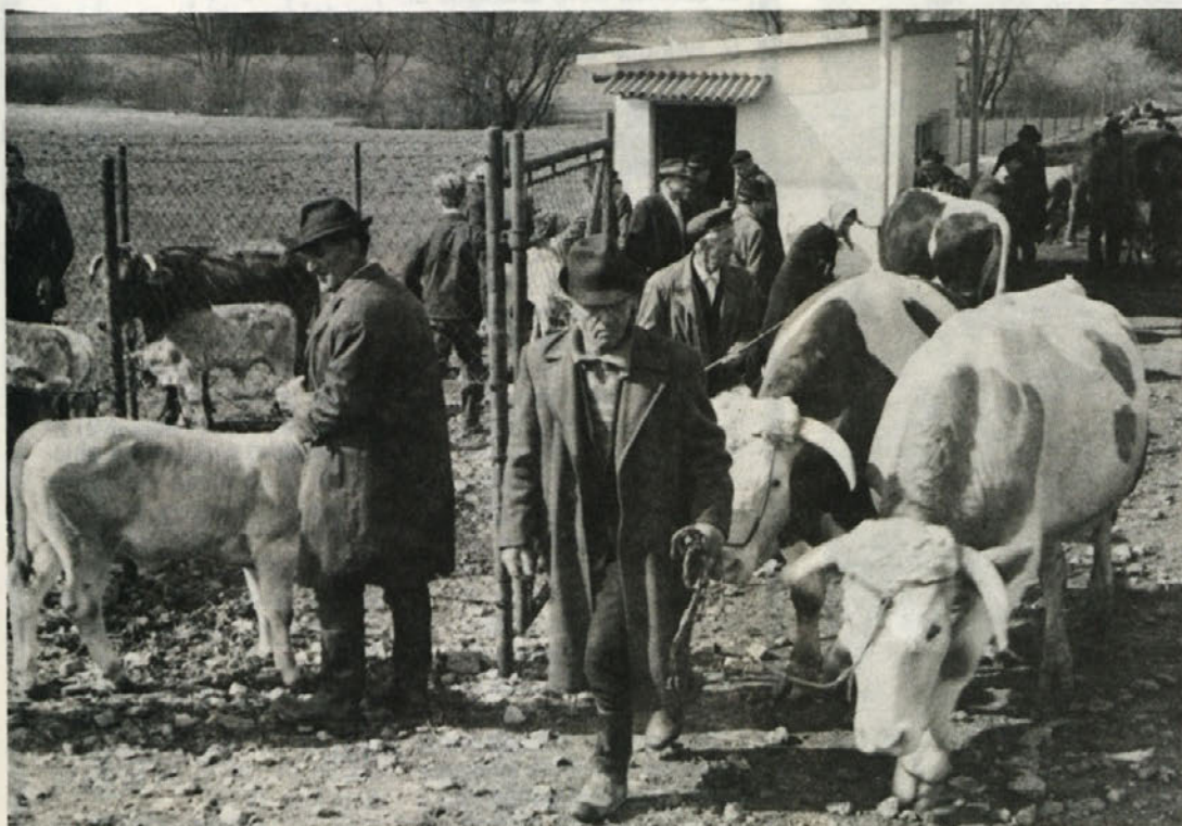
Kadar je v Metliki sejem – takrat je na cestah velika gneča in lokali so polni sejmarjev. Tudi marsikateri zaposleni vzredi na „drugem šihitu“ živinčje in ga proda. Služba in kmetija, to je najpogostejša kombinacija za poprečnega Belokranjca