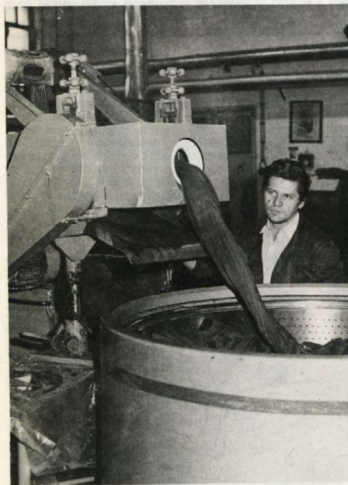
Ko je blago pobarvano, ga v veliki centrifugi še osušijo.