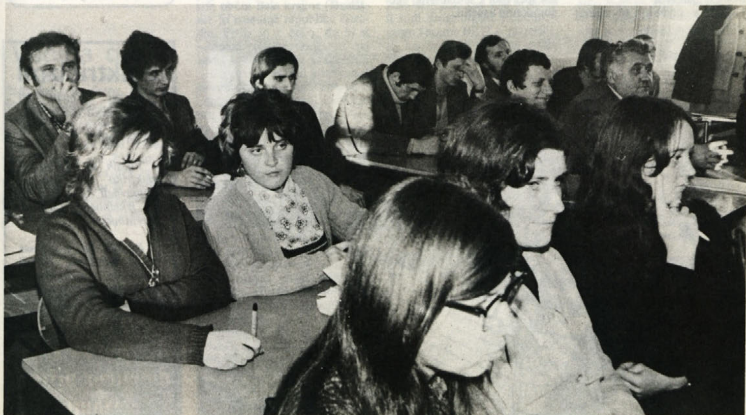
Posnetek je z letne konference osnovne organizacije Zveze komunistov v BETI. Videti je mlade obraze, ker je med komunisti zares največ mladih ljudi. Prav bi bilo, če bi sprejemu novih članov posvetili še več skrbi.