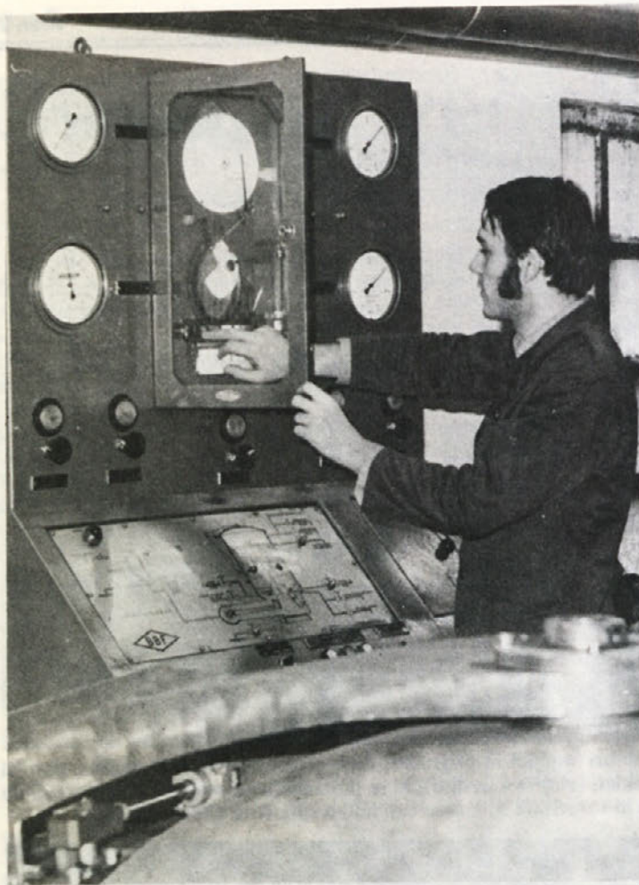
Barvanje surove preje na HT aparatih je težko in naporno delo. Delavci so izpostavljeni visoki temperaturi in vlagi.