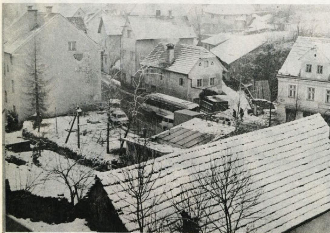
Pa smo jo dočakali, belo snežno odejo. Je sicer tanka in za smučarje in sankarce ni primerna, toliko pa je snega, da ne bomo pozabili bele zime . . .