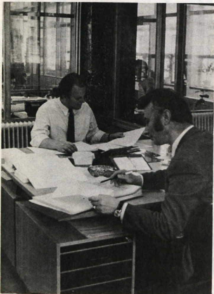
Iz mehanografskega centra v BETI