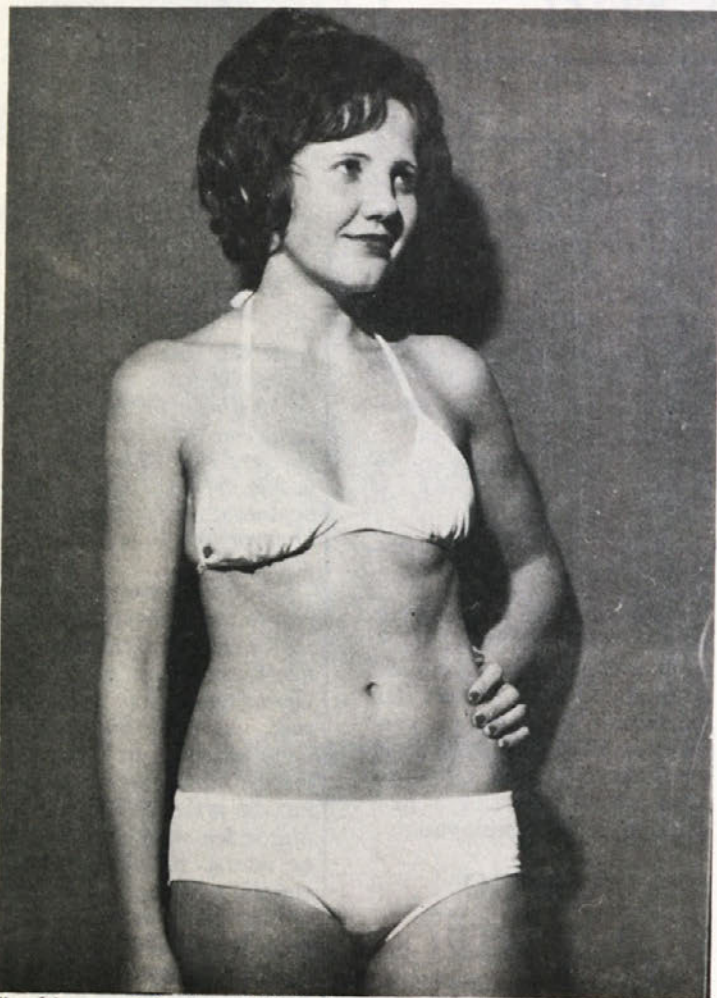
Zimski meseci bodo minili in kmalu nas bo peklo poletno sonce. Martina si je že oblekla kopalke brez košaric iz pomladno poletne kolekcije BETI za leto 1974. Kmalu bomo take modele kupovali.