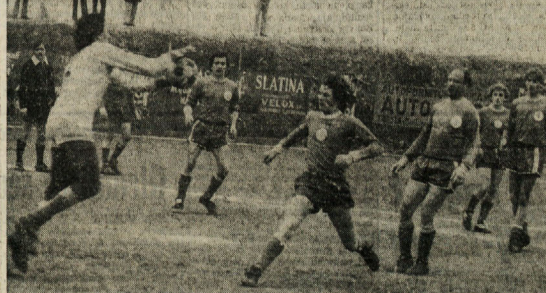
Posnetek z nedeljskega slovenskega derbija 2. nogometne AL med Bregom in Gajo

V PHILADELPHI Barazzutti in Franulović izločena v drugem kolu PHILADELPHIA — Američan Geoff Masters je v drugem kolu mednarodnega teniškega prvenstva ZDA v dvorani s 5:7, 6:3, 6:3 premagal nosilca skupine št. 5 Italijana Corrada Barazzuttija.