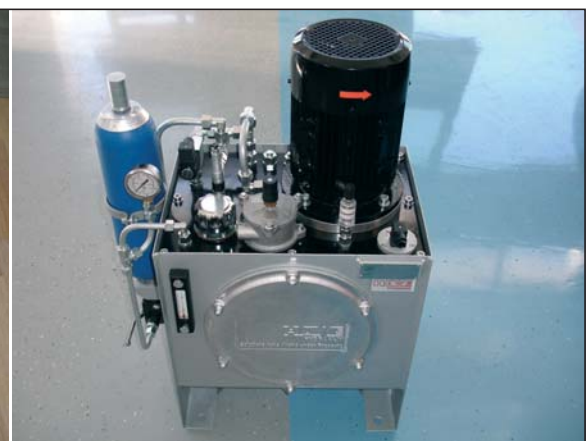
Lastna proizvodnja hidravličnih agregatov v podjetju HAWE Hidravlika, d. o. o., Petrovče