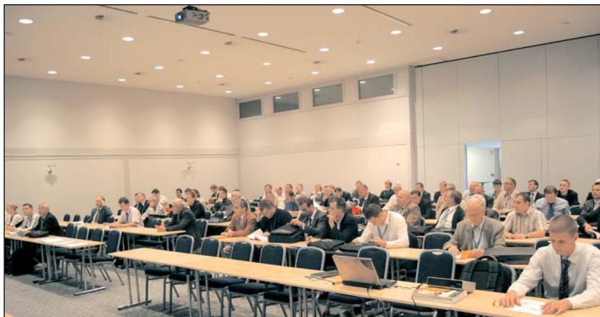
Volilni občni zbor SDFT, Maribor, september 2009

Ventil: Med pomembnejše naloge prav gotovo spada njegova predstavitel in redno obnavljanje podatkov, vsebine dela in dejavnosti članstva na