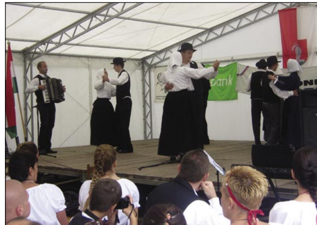
Od domanji skupin je gorstaupila sakalauvska folklorá tö

vönositi dobre, vrauče golažove župe z grajom, je dež že copoto na šator. Lekar je zatok bilau, ka je zadvečerka na blagoslovitev pa prejkdivanje kulturnoga doma malo menje lidi prišlo. V svojom guči - na pokritoj terasi ozajek