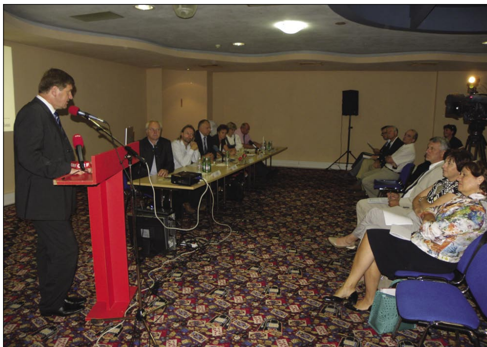
Drugega zasedanja Agroslomaka sta se udeležila tudi ministra Franc Bogovič in Ljudmila Novak

Ministrica Ljudmila Novak in minister Franc Bogovič sta izpostavila pomen razvoja kmetijstva med Slovenci v sosednjih državah in članom Agroslomaka zagotovila pomoč pri uresničevanju njihovih projektov. Ministrica Ljudmila Novak