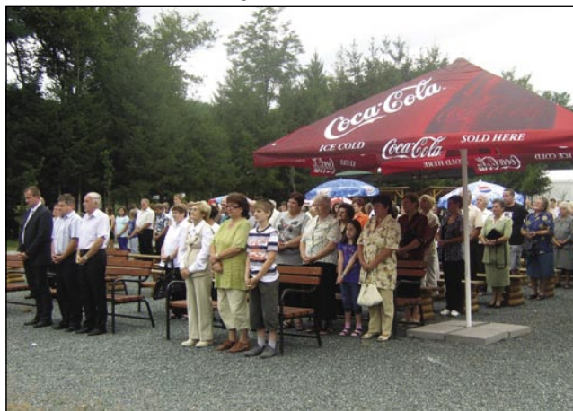
K meši v nauvom parki je dosta lidi prišlo

»Grato je té lejpi prostor, gda pa gda bi leko čez leto tú darivali sveto mešo ob kakši priliki. Tak je tau gnes tö, gda mate srečanje, ka smo malo vanej. Vtakšoj naravnoj katedrali, nej samo v katedralaj iz kamna pa cügla«