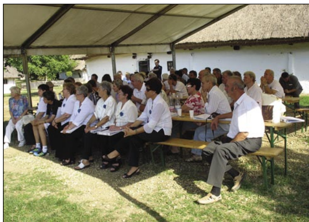
V ladnoj senci šatora je eške kulturni program lepši

ni, za eno leto pa je založba püšpekije vödala knige, štere gučijo o dühovniškom pozvanji pa võrnosti. Dosta Peštarov pa Sombotelčarov, šterim so se knige povidle, je küpilo roman, pa je dalo s prevajalcom podpisati. Peštanski Slovinci so pozvali gospauda Merklina, aj pridejo v glavni varaš nutpokazat knige, uni pa so vsikšoga pozvali na prauško v Prekmurje.