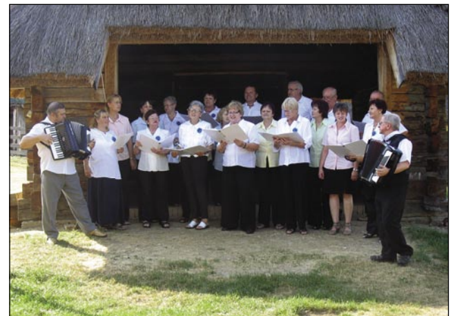
Če rejsan sta Pešt pa Somboteu daleč, Slovinci vejo vküper spejvati

drügi krajov (Cankova, Murska Sobota, Andovci, Mosonmagyaróvár, Kapela, Subotica, Beč; Slovensko etnološko društvo, Družtvo porabski upokojencov). Na vsej programaj se je gučalo pa spejvalo slovenski.