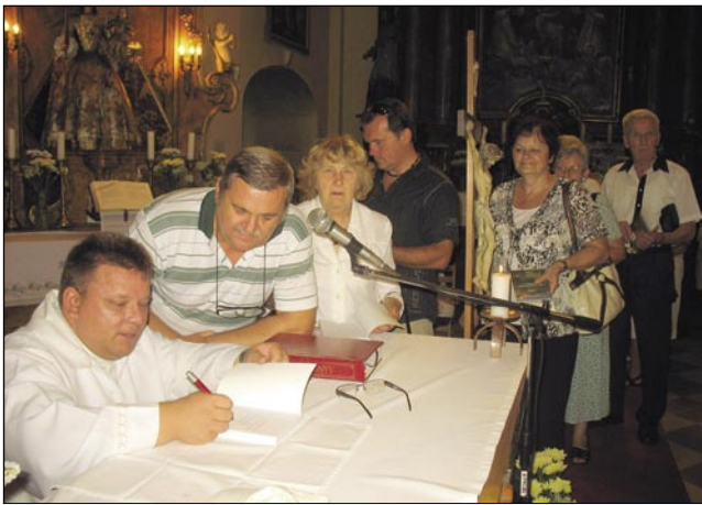
Gospaud Merkli so vsikšoma rade vaule podpisali roman