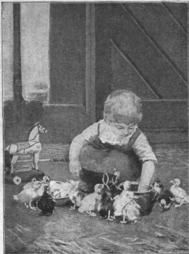
Račke bodo mokre!