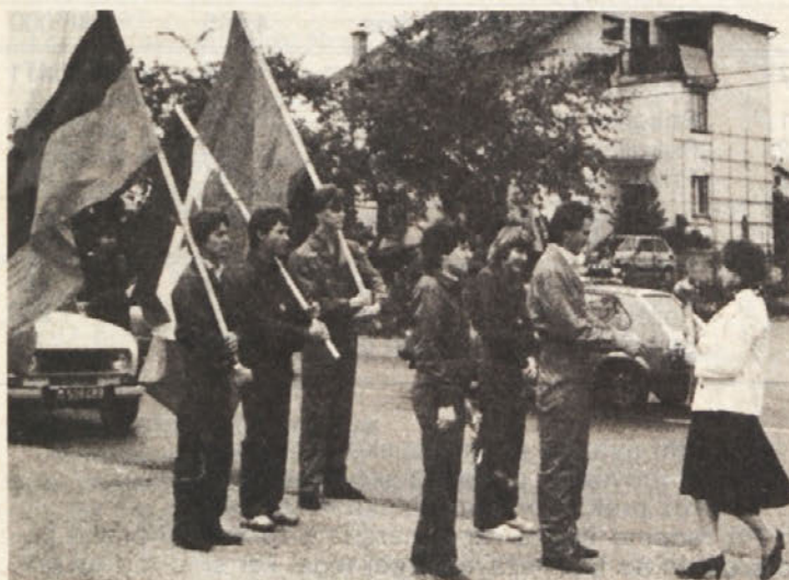
11. maja ob 8.45 so naši mladinci prevzeli in ponesli štafeto, simbol mladosti, bratstva in prijateljstva narodov in narodnosti SFRJ, skozi delovne prostore naše delovne organizacije.

Nabava repromateriala iz uvoza poteka v treh smereh, in sicer: (Nadaljevanje na 2. str.)